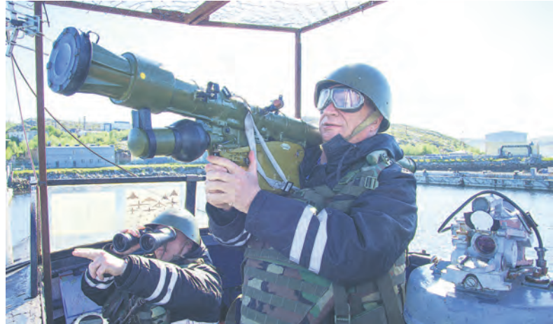
Подводники готовятся к отражению атаки беспилотных летательных аппаратов.

О том, какие задачи возлагаются на экипаж ракетного подводного крейсера стратегического назначения «Тула», сказать несложно. Его моряки должны пребывать в постоянной готовности выполнить возложенные на них функции, парализовать вероятного противника в любой точке мира.