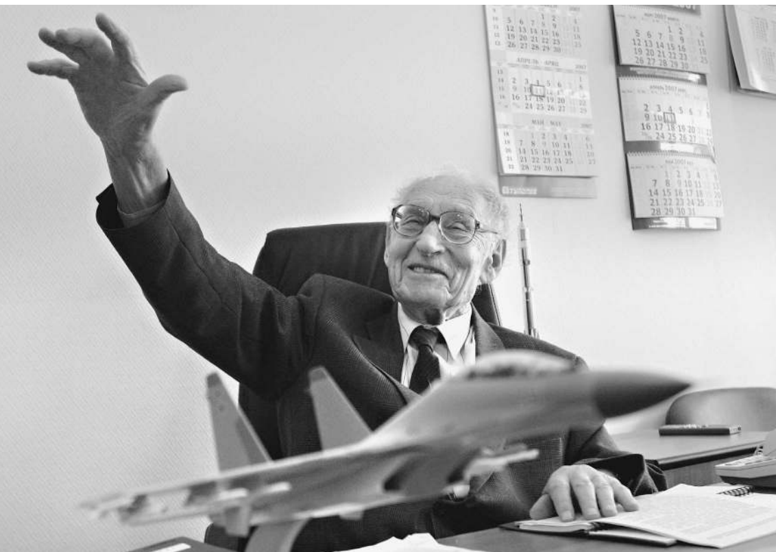
Создатель высокоскоростных центрифуг для обогащения урана академик Иосиф Фридляндер сохраняет высокий заряд оптимизма

Если с войнами мы еще миримся, то ядерной войны не хочется никому. Атомное оружие на планете имеется всего у семи государств. Но десятки стран на всех континентах стремятся овладеть ядерными технологиями, и некоторые не прочь освоить полный ядерный цикл. Ситуацию осложняет угроза со стороны террористов, которой в те времена, когда создавалась атомная бомба, просто не существовало. В мире предложено несколько инициатив по проблеме доступа к ядерным технологиям при строгом соблюдении принципа безопасности. Ближе всех к реализации — Международный центр по обогащению урана на базе прежде закрытого Электролизного химического комбината в Ангарске, где побывал корреспондент «Известий». → стр. 10