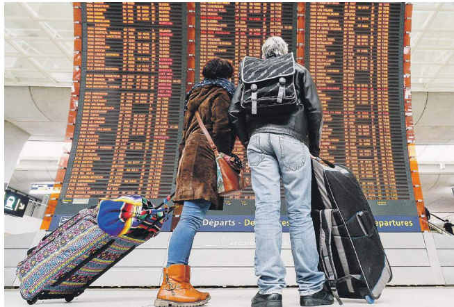
Каждый третий вернувшийся объясняет свое решение политическими мотивами