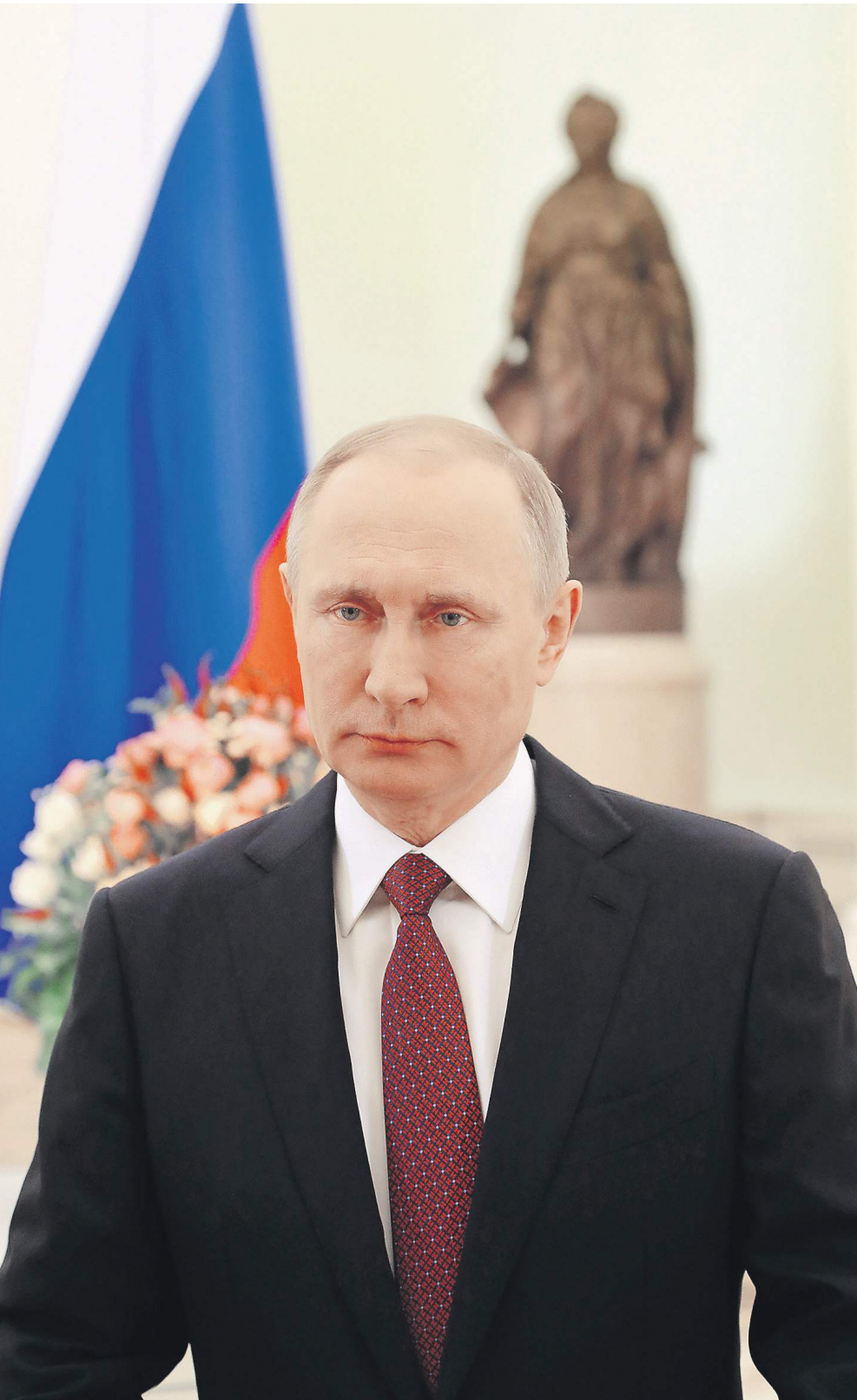
Президент отметил, что в заботах о детях и внуках, о своей семье у женщин не бывает выходных

Большинство сотрудников Брянского перинатального центра действительно женщины. Он построен в рамках национального проекта «Здравоохранение» и оснащен самым современным российским и иностранным оборудованием. По словам главы государства, таких учреждений в стране уже 75 и планируется открыть еще 19. Владимир Путин отметил, что в России удалось переломить негативные демографи-