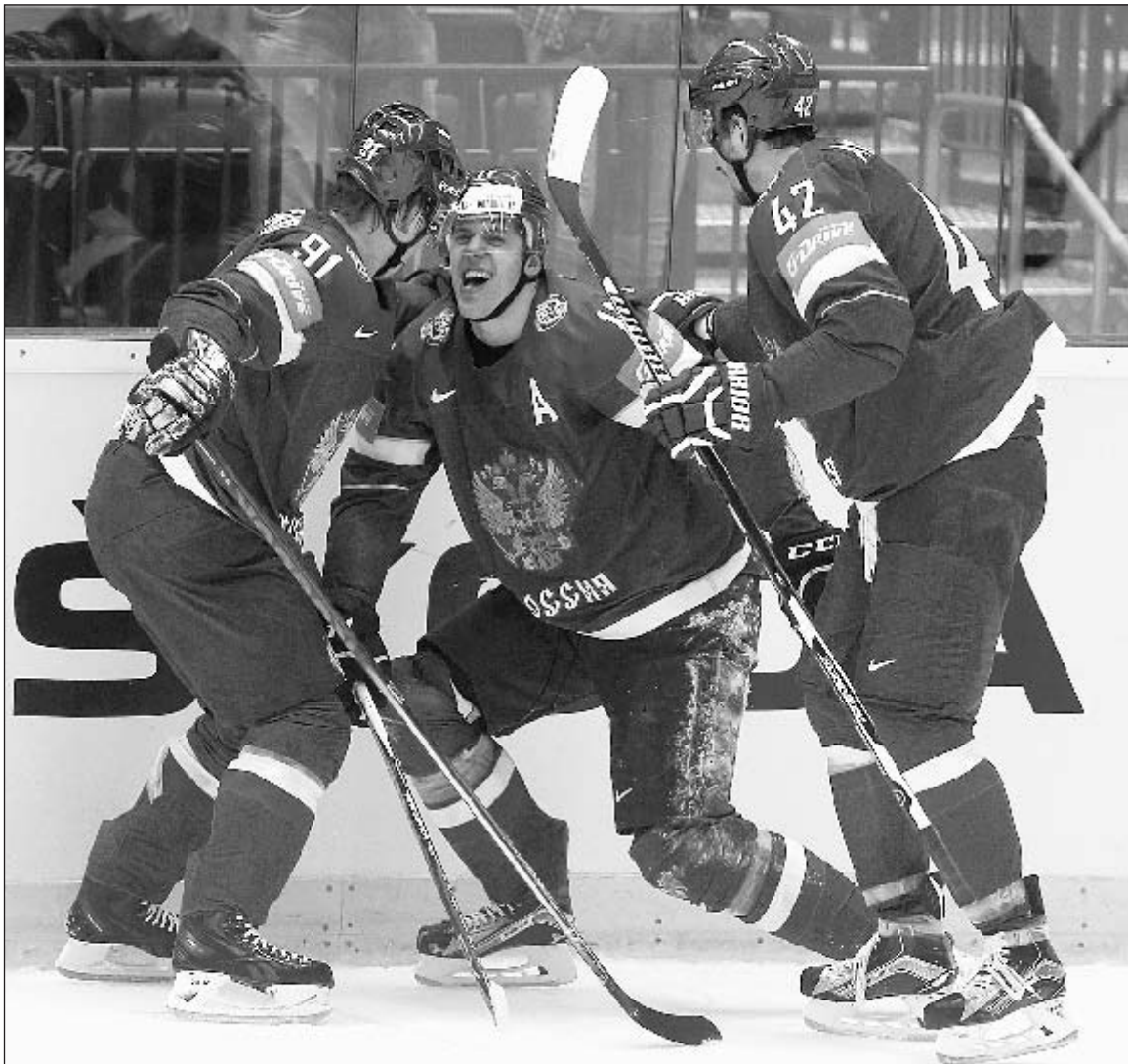
Вчера. Острава. Швеция - Россия - 3:5. Нападающие Владимир ТАРАСЕНКО (№ 91) и Артем АНИСИМОВ поздравляют Евгения МАЛКИНА (в центре) с очередной заброшенной шайбой.

Вчера сборная России, в образцово-показательном стиле победив шведов, продемонстрировала, что стала командой, способной повторить золотой результат Минска-2014