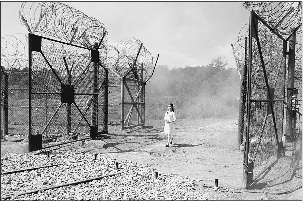
18 сентября. Репетиция церемонии открытия демилитаризованного коридора

«Итальянские промышленники проявляют интерес к участию в строительстве железной дороги между Северной и Южной Кореями и к ее соединению с Трансiberийской магистралью», — рассказал «Известиям» председатель Союза промышленников Рима Джанкарло Элиа Вальери. — Магистраль способна достичь Дальнего Востока от итальянского города Триеста через Австрию, Венгрию и Россию. Северокорейцев весьма заинтересовала итальянская и в целом европейская технология. Поэтому мы собираемся создать континентальный консорциум вместе с французами и немцами».