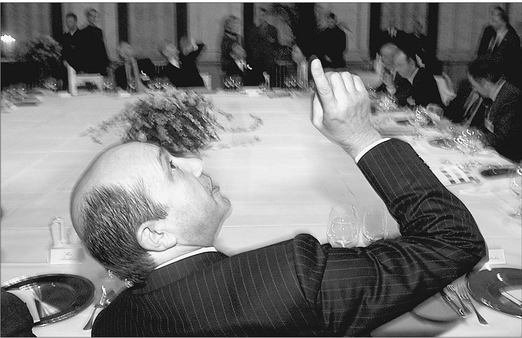
Игорь Иванов пытается угадать верное направление внешней политики