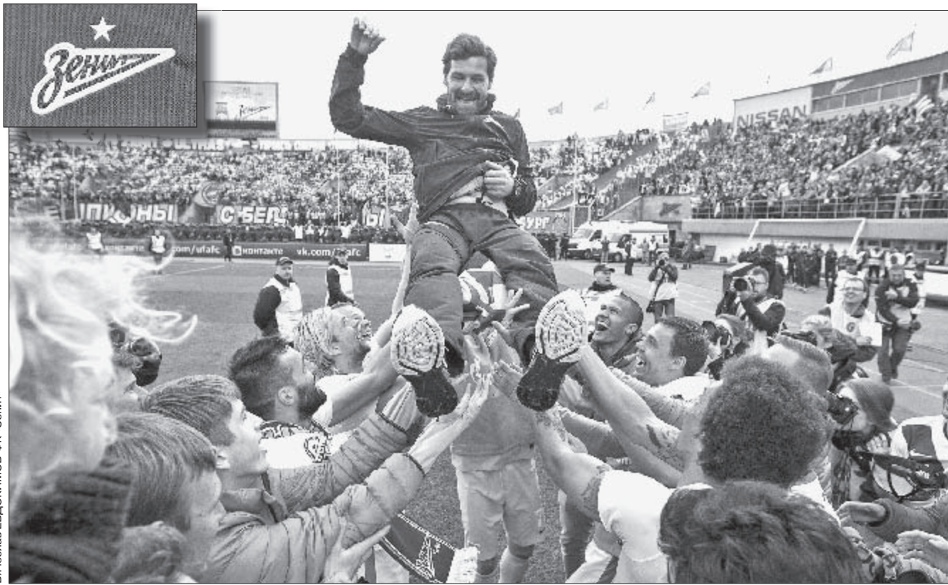
Вчера. Санкт-Петербург. «Уфа» - «Зенит» - 1:1. Андре ВИЛЛАШ-БОАШ и его команда празднуют пятое чемпионство питерского клуба. Теперь на форме сине-бело-голубых появится первая звезда.

Ровно десять лет назад, 18 мая 2005 года, состоялась главная победа в истории клубного футбола нашей страны. ЦСКА стал первой командой из России, которая выиграла Кубок УЕФА. В финале армейцы взяли верх над лиссабонским «Спортингом» (3:1). А накануне юбилея единственный российский тренер - победитель еврокубка в беседе с обозревателем «СЭ» вспомнил, как это было.