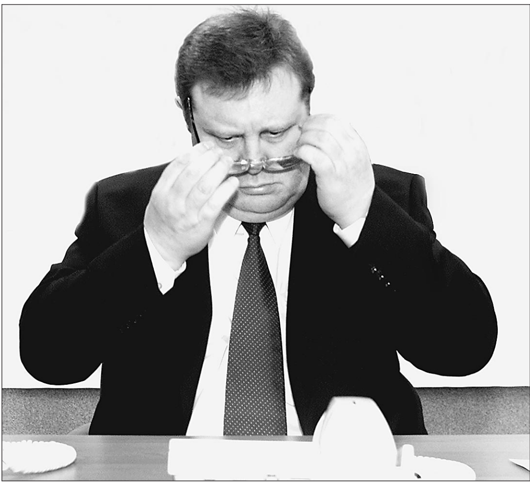
Генеральный прокурор уверен: стихийными бедствия не бывают