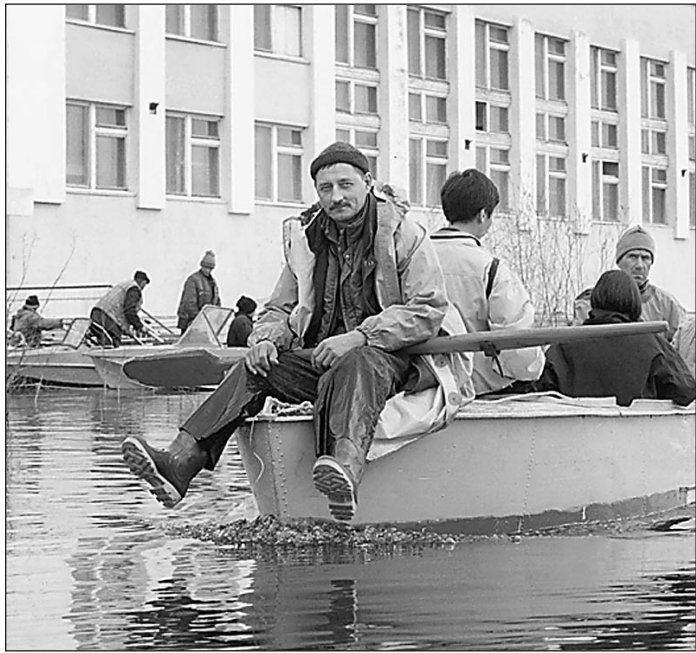
Июнь 2001 г. Наводнение в Якутске