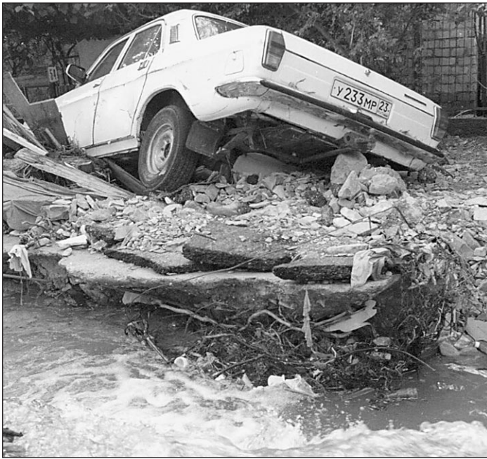
Июнь 2002 г. Наводнение в Ставропольском крае