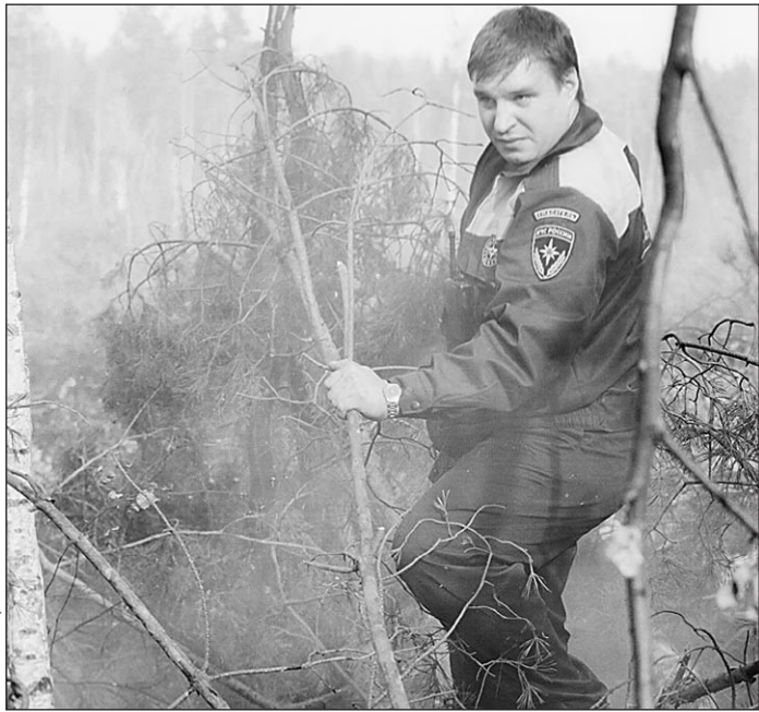
Сентябрь 2002 г. Пожары в Подмоскowie