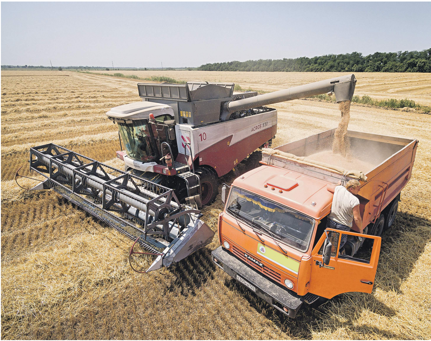
Российская пшеница пользуется спросом в Египте, Турции и странах Ближнего Востока