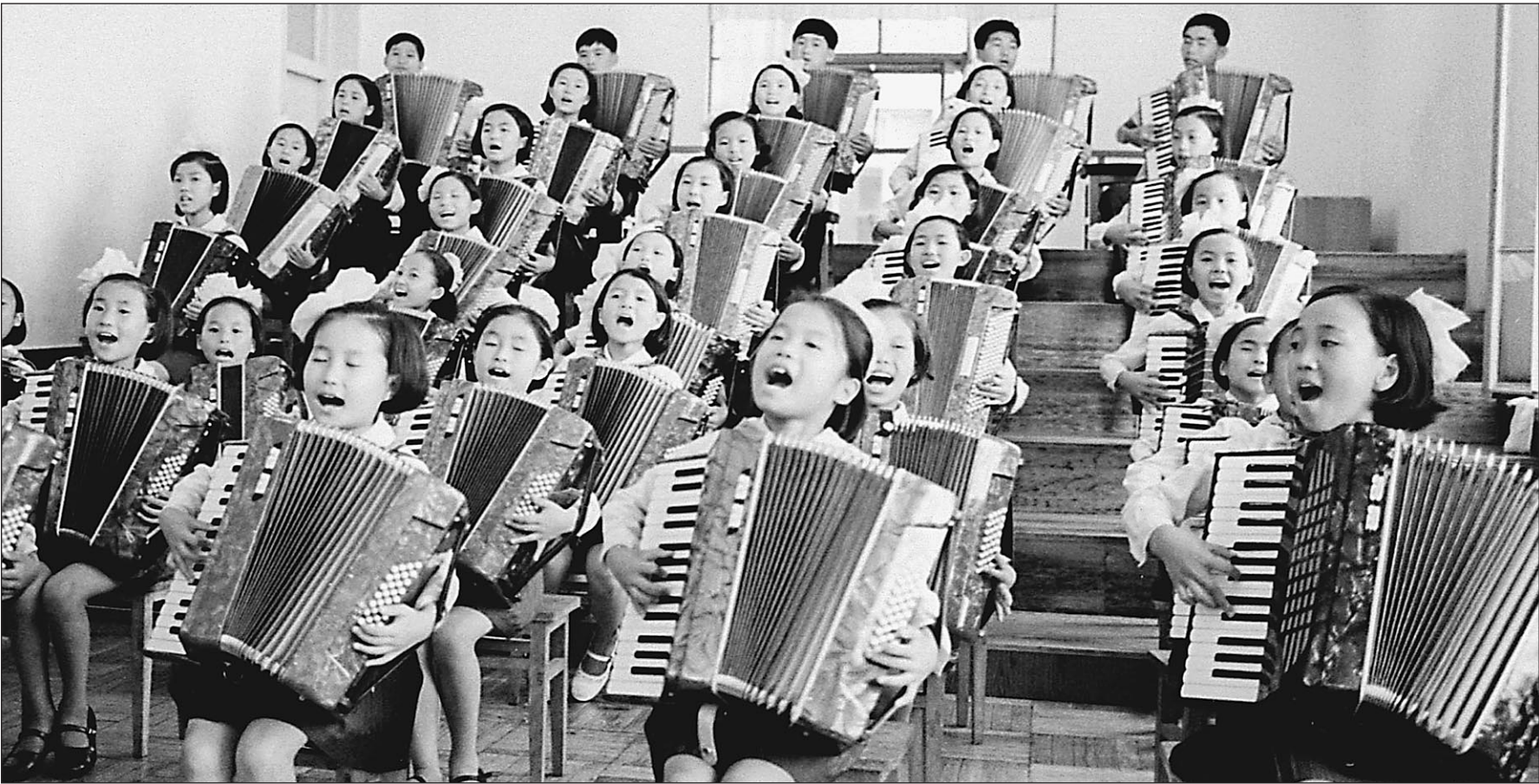
В Северной Корее люди привыкли радоваться и стабильности, и переменам

Власти, правда, уверяют, что и зарплаты повысились «соответственно». Хотя, по словам очевидцев, цены растут все-таки быстрее.