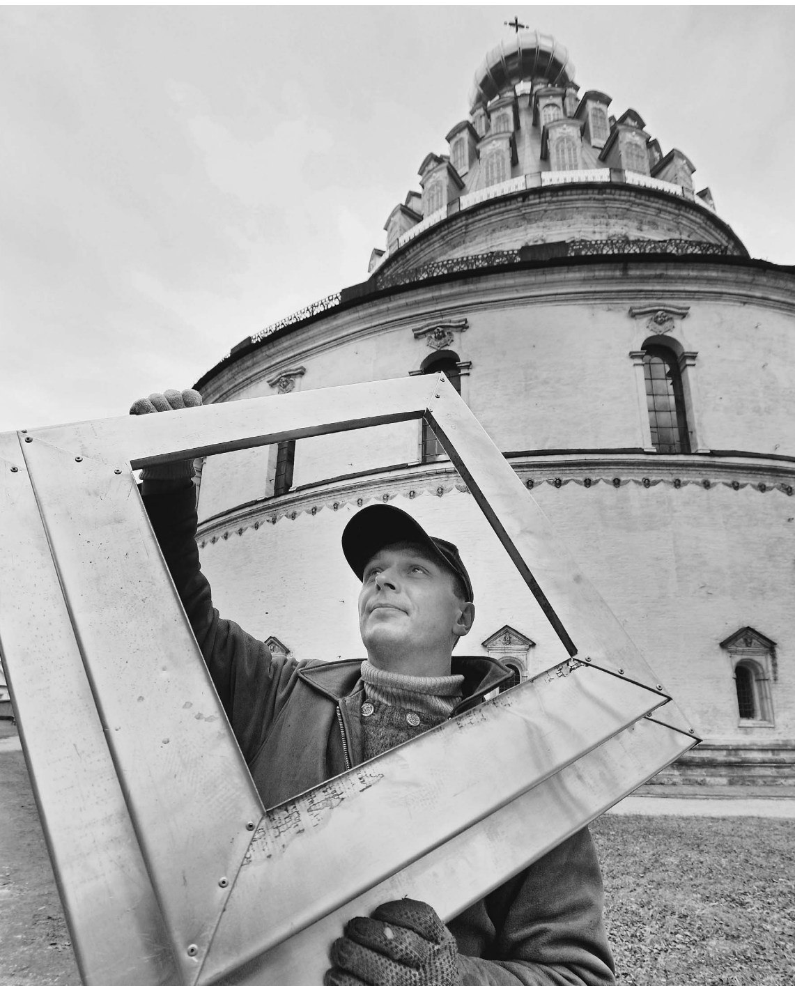
Воскресенский Новоиерусалимский монастырь в Подмосковье восстанавливают уже полтора года. На этом решили поживиться кибермошенники

Кибермошенник из Липецка покусился на святое