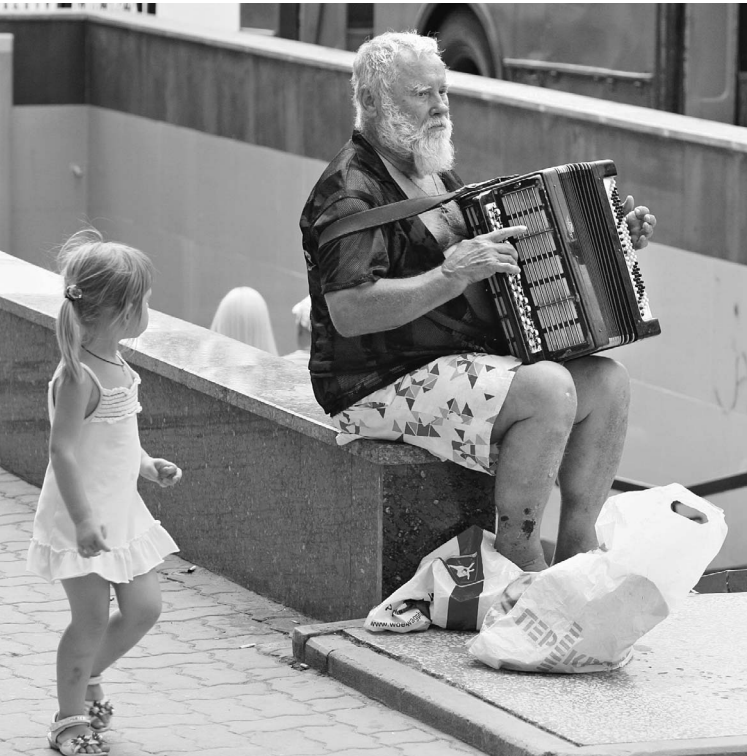
В период массовых увольнений безработные зарабатывают чем могут