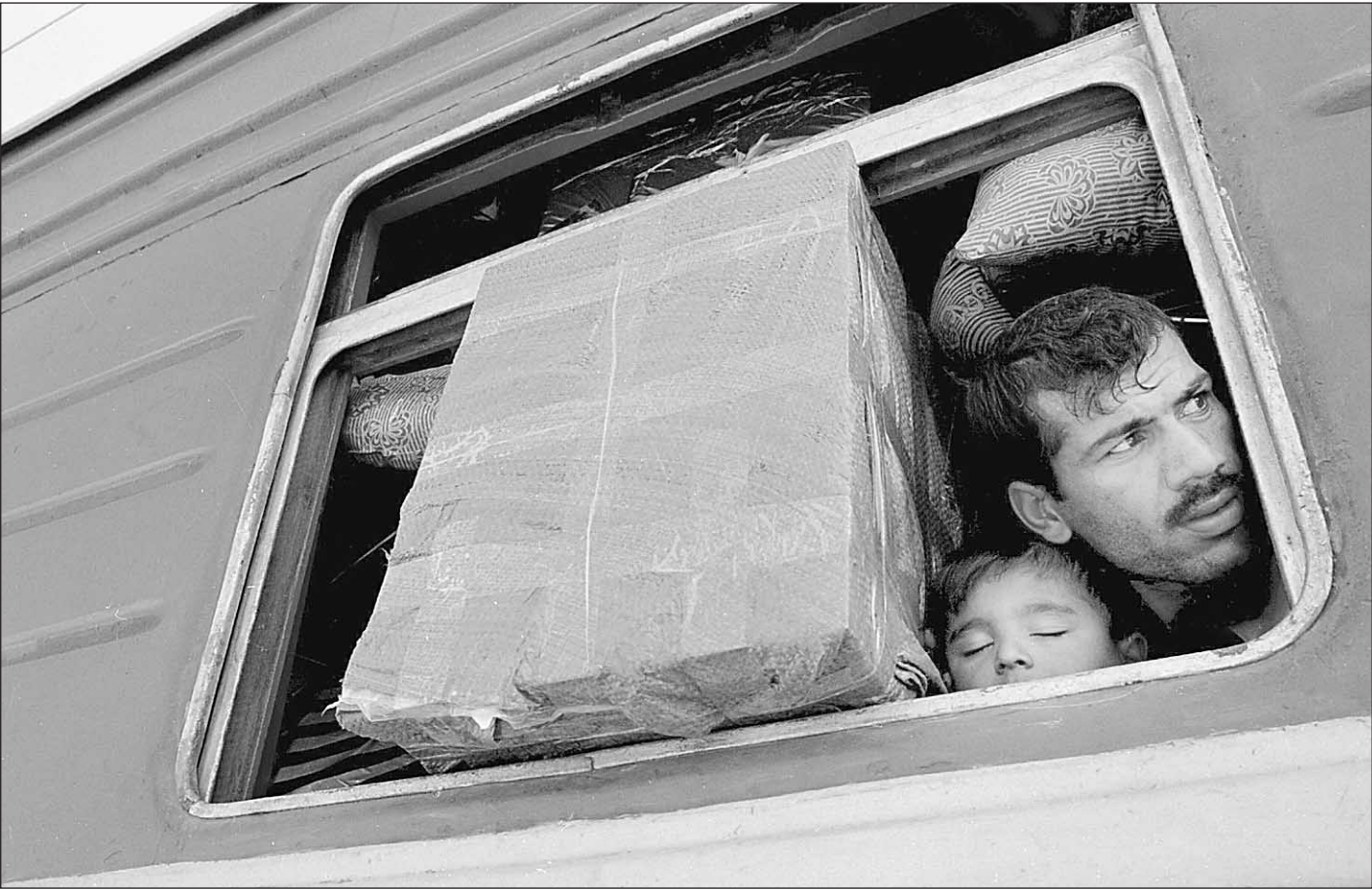
Встречайте очередную партию наркотиков (поезд № 224 «Душанбе—Астрахань»)

Более того, крен в сторону медицинского решения проблемы уже породил в стране систему, которую самые невосдержанные на язык специалисты называют «вторичной наркоманией» — сеть центров и частноплатящих врачей, которые «сто процентно» гарантируют излечение несчастных. По некоторым данным, доходы этой сети сопоставимы с доходами крупных наркодилеров, а эффективность стремится к нулю. Правда заключается в том, что вылечить от наркомании нельзя — можно лишь добиться временного воздержания от употребления наркотиков. При этом ни один наркоман не перестает быть наркоманом, так же как пожизненно остается алкоголиком алкоголик. Но вот каким будет время ремиссии, вернется ли больной к более