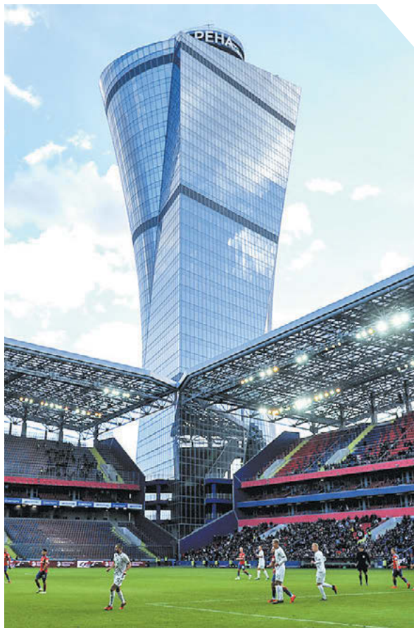
Дарья Исаева «СЭ»

Вчера председатель ВЭБ.РФ Игорь Шувалов сообщил, что корпорация начала поиск зарубежного инвестора для армейского клуба