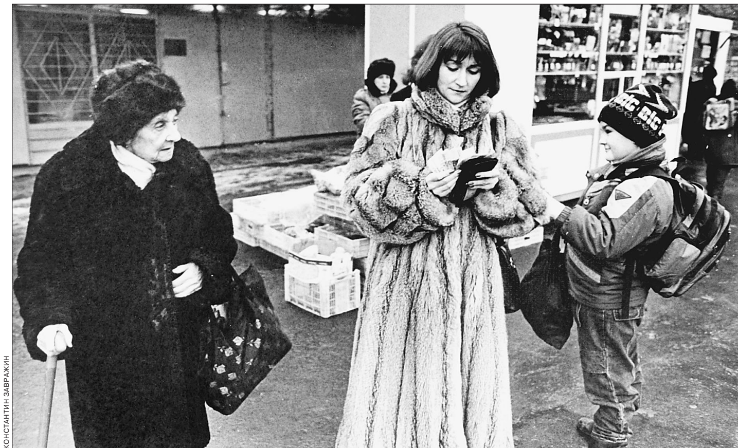
Платить всегда тяжело

Вчера бюджетный комитет Думы рассматривал правительственные поправки к бюджету-2001. От принятия или непринятия этих поправок зависит, как именно мы будем платить в этом году советский долг Парижскому клубу. Поправки одобрены, но в таком виде, что их уже не назовешь правительственными. Кредиторы могли насладиться картиной очередной ссоры вокруг распределения так называемых дополнительных доходов бюджета «нижней страны». Впрочем, депутатов не меньше занимают и другие вопросы мироустройства. Так, вчера в другом думском комитете всерьез обсуждали трудовой конфликт в каком-то астраханском трамвайно-троллейбусном управлении. Между Парижским клубом и трамвайно-троллейбусным управлением широко раскинулась наша законодательная власть. И решает вопросы на пользу Отечеству. Как умеет.