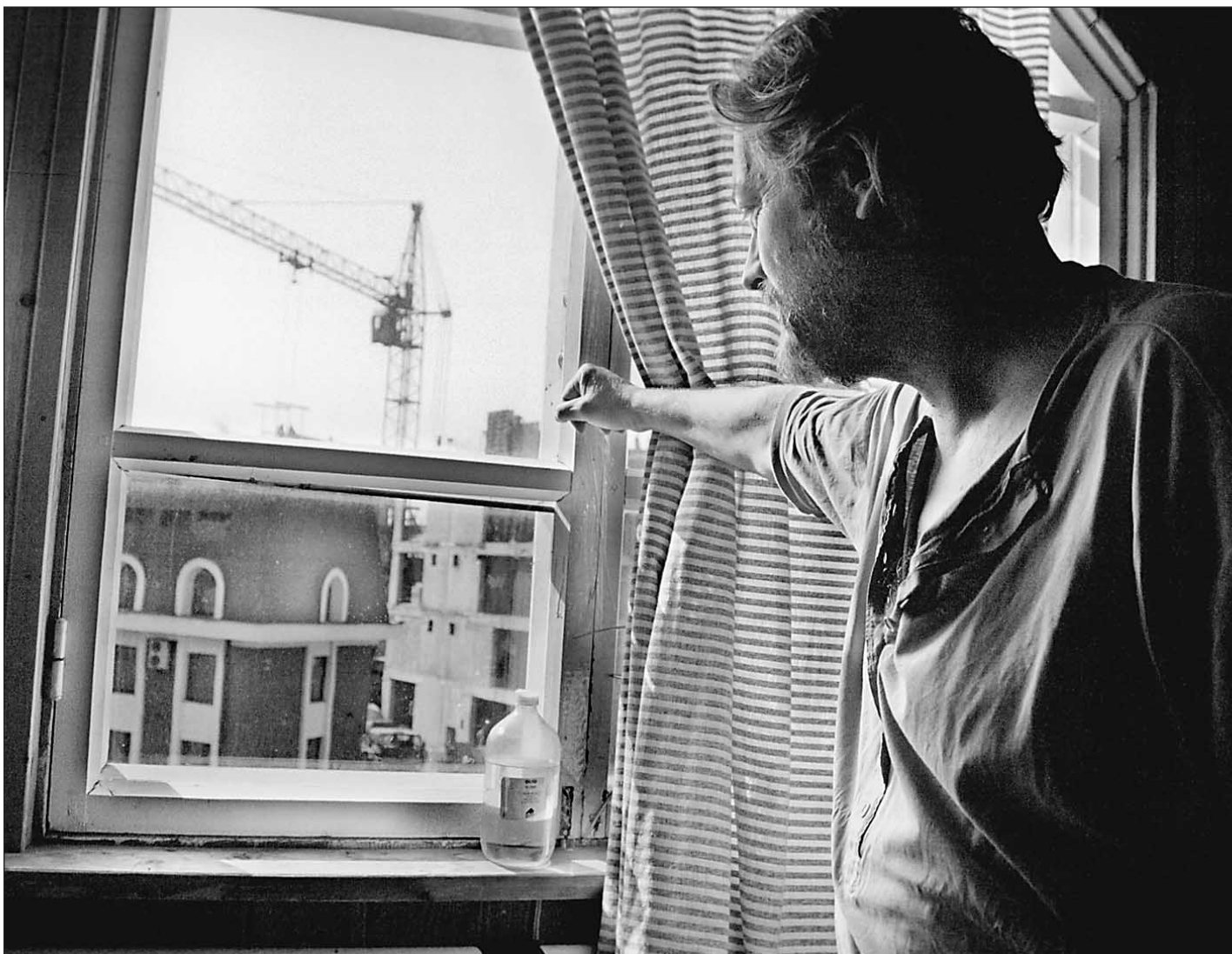
Квартирный вопрос испортил приватизацию

Криминальная хроника последних лет насчитывает десятки случаев, когда люди гибли или исчезали, завещая или подарив свое жилье совершенно посторонним людям. Детей — выпускников школ-интернатов, получивших от города жилье — через