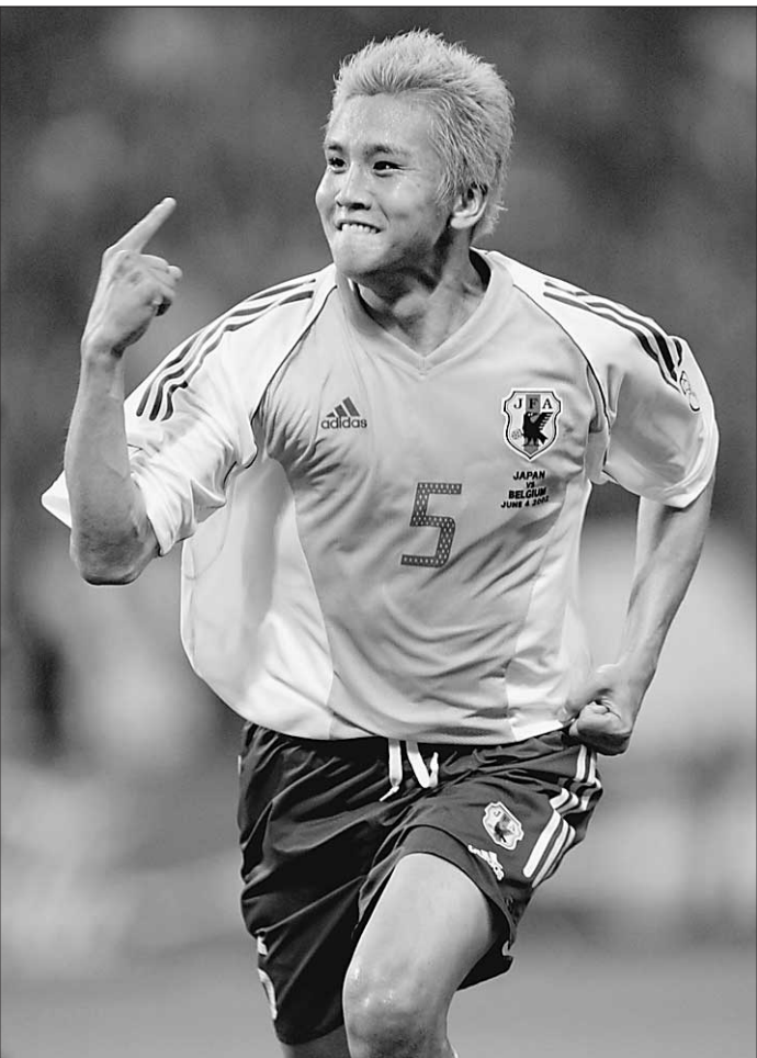
Юниси Инамото только что забил второй гол бельгийцам