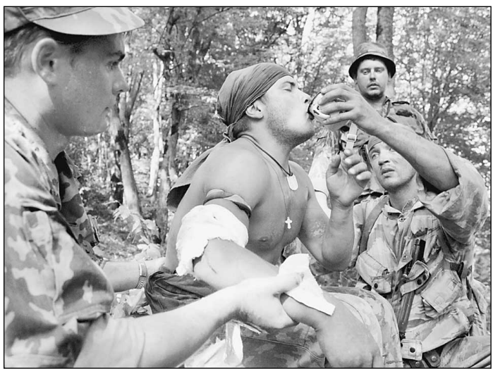
Российские солдаты знают, за что воюют в Чечне

Офицер впервые отсудил «боевые» командировочные у государственных органов