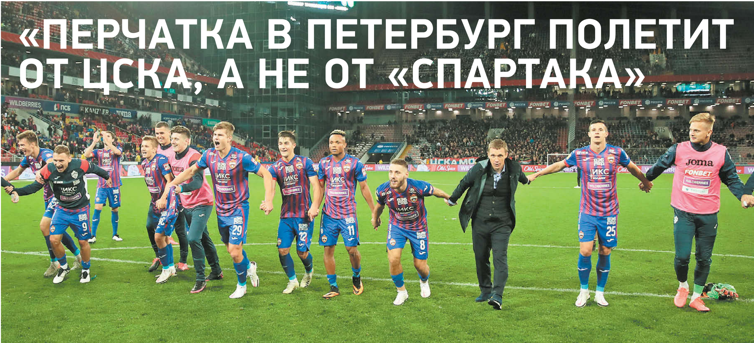
Воскресенье. Москва. ЦСКА – «Спартак» – 3:1. Армейцы празднуют победу