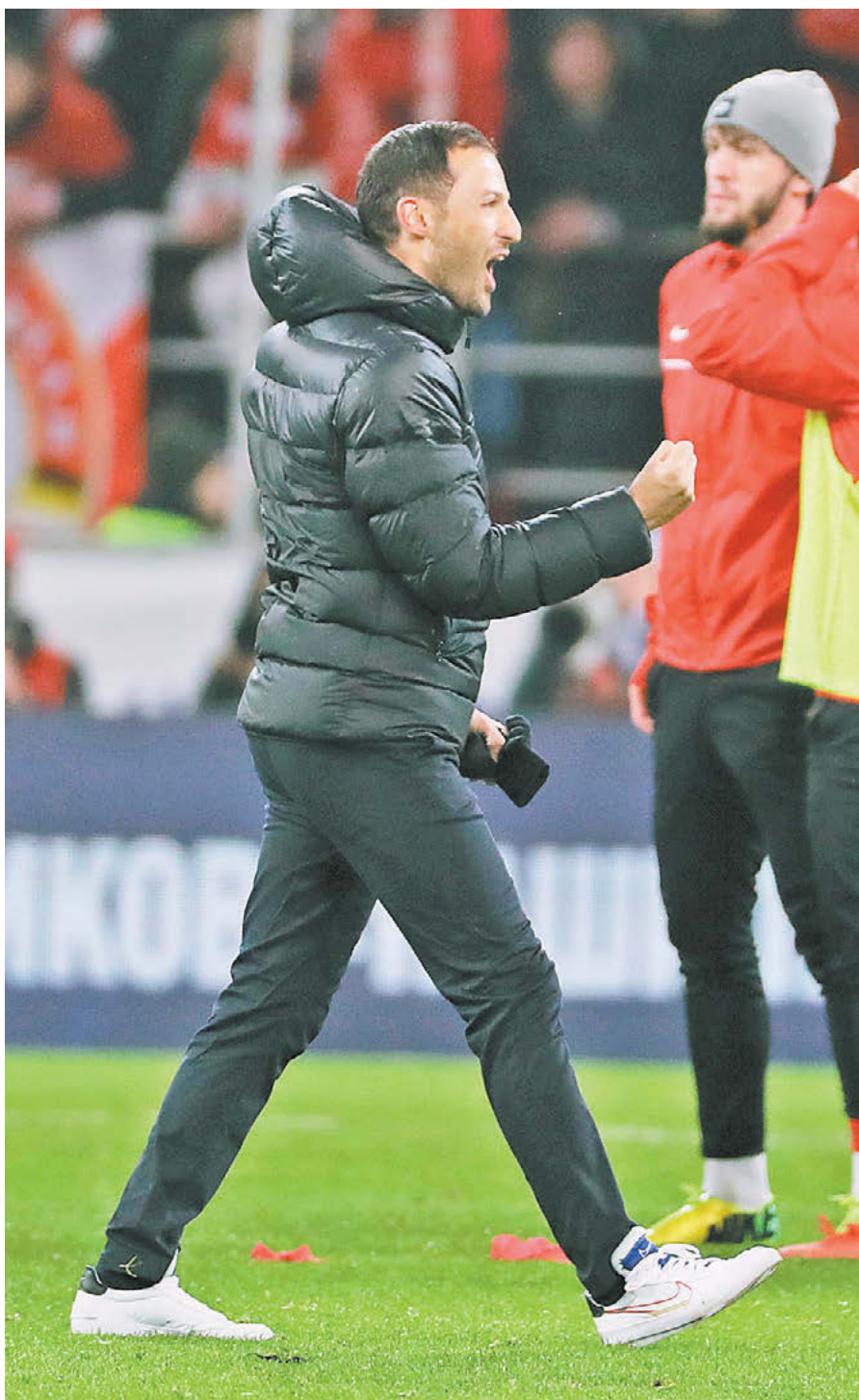
Вчера. Москва. Тушино. «Спартак» – ЦСКА – 3:2. Эмоции главного тренера красно-белых Доменико Тедеско после финального свистка