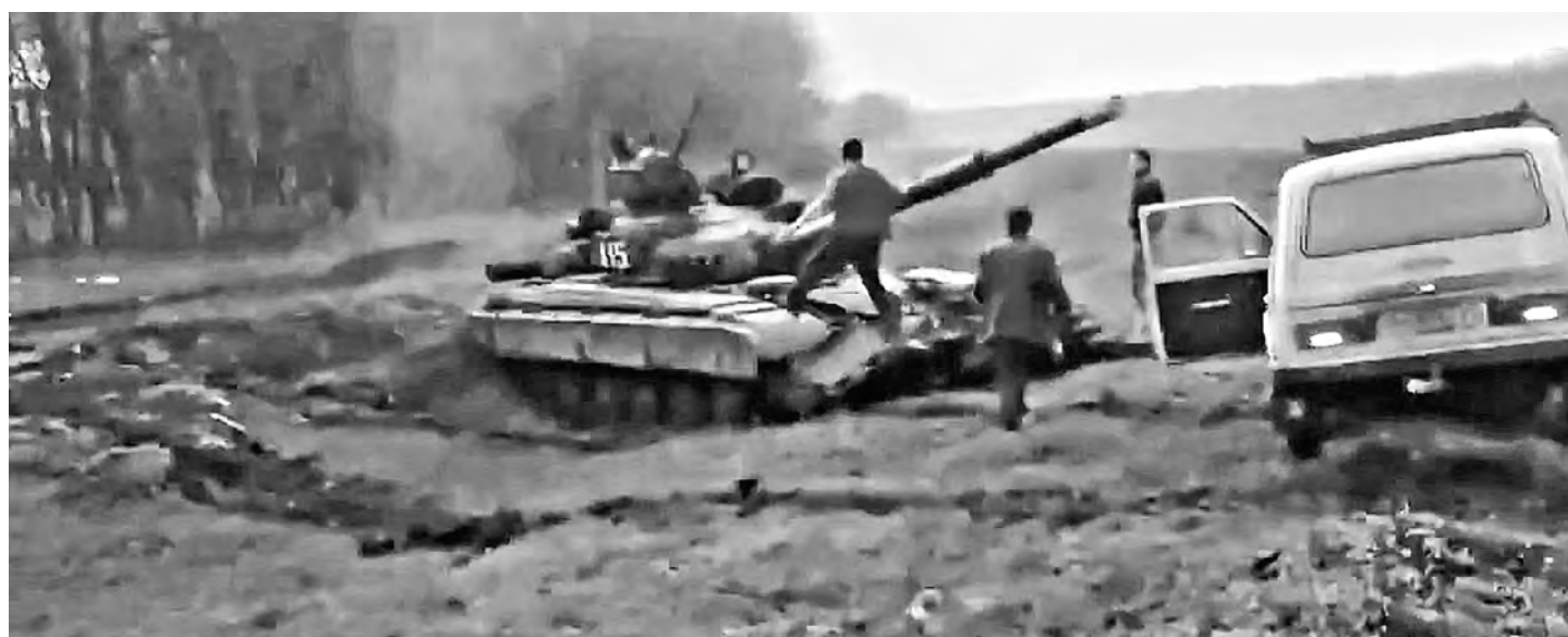
Жители села Родинское загнали Т-72 словно «кабанчика на охоте». Экипаж танка бросил машину в поле.

Причем с риском быть захваченными местными. Так в селе Родинское жители «загоняли» боевой Т-72 словно жирного кабанчика на охоте. Десяток «Нив» окружили грозную машину у оврага. Экипаж — молоденькие резервисты тотчас покинули машину. Теперь у самообороны есть танк.