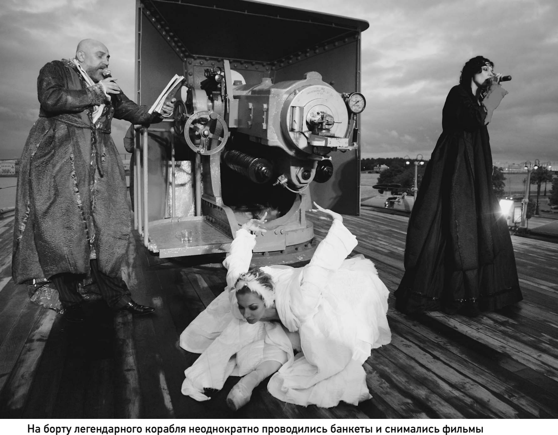
На борту легендарного корабля неоднократно проводились банкеты и снимались фильмы