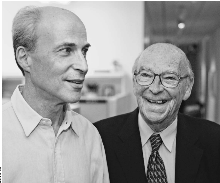
Два нобелевских лауреата Роджер Корнберг (слева) и его отец Артур Корнберг. 2006 год. Калифорния

Назначение Жореса Алферова, которому уже 80 лет, с учетом того, что сооружение иннограда самыми стремительными темпами займет 5–7 лет, имело единственный резон — его научные связи в сообществе нобелевских лауреатов. Непреложный факт: никто из российских ученых не имеет