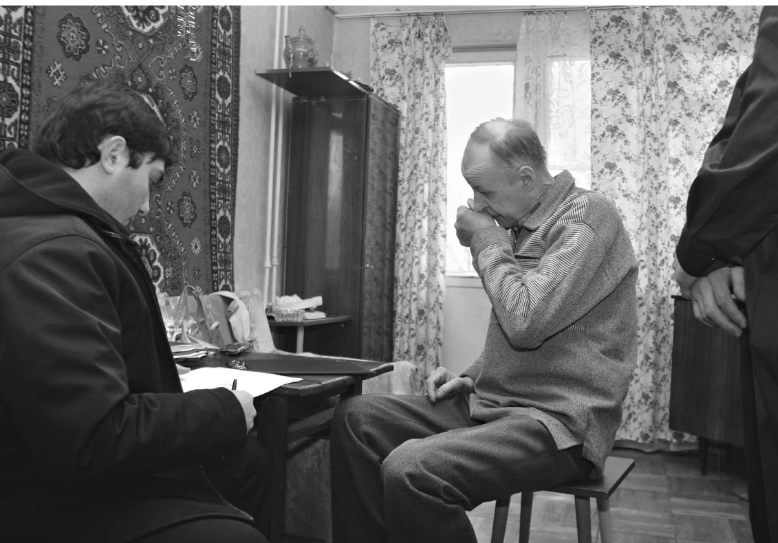
Самое главное оружие коллекторов — они действуют должникам на нервы

ОФИЦИАЛЬНЫЕ (ЦЕНТРАЛЬНЫЙ БАНК РФ) КУРСЫ ВАЛЮТ К РУБЛЮ НА 28 АПРЕЛЯ