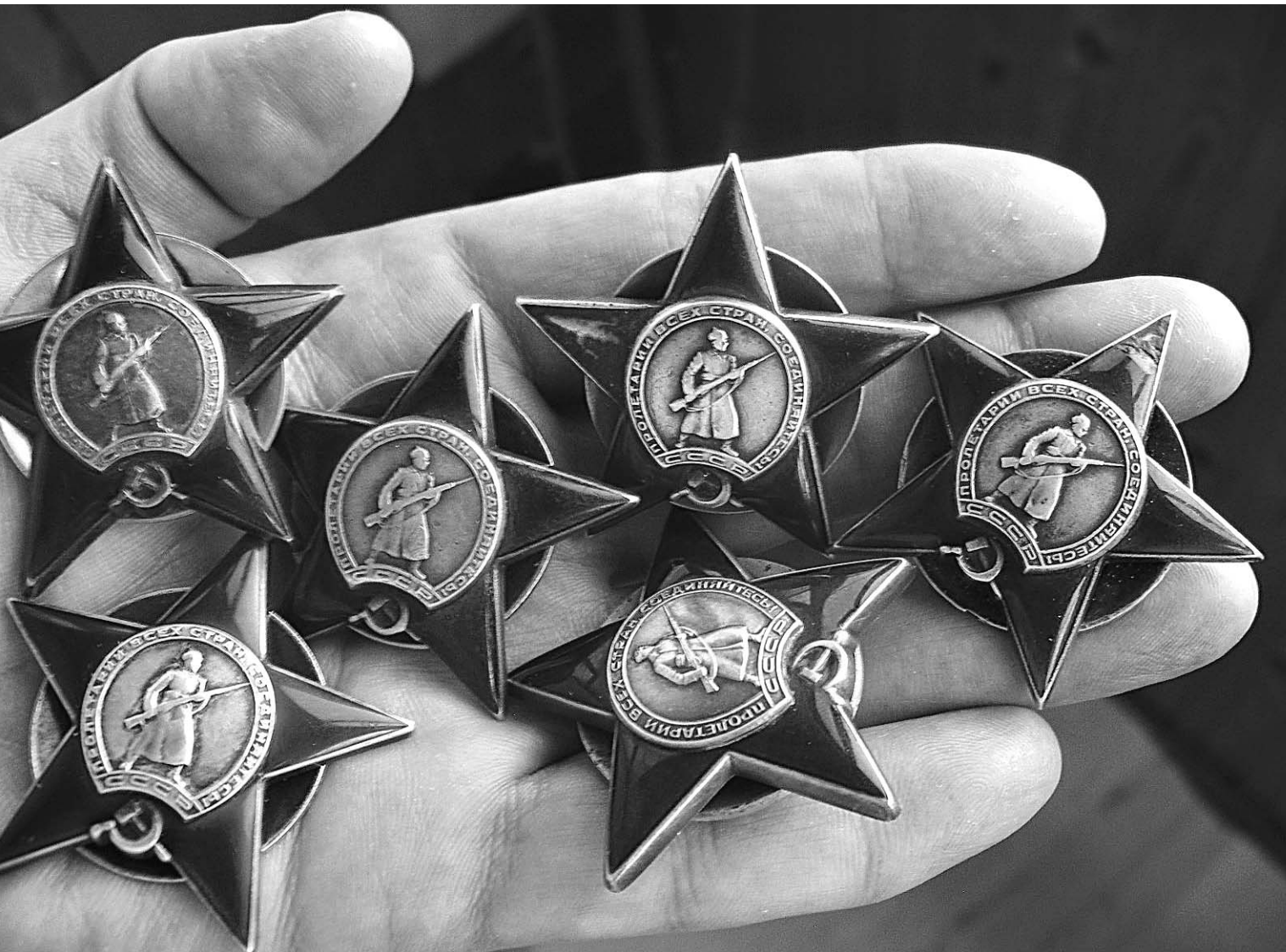
Боевые ордена Красной Звезды продают оптом и в розницу

Накануне 65-летия Победы активизировался подпольный рынок торговли военными наградами