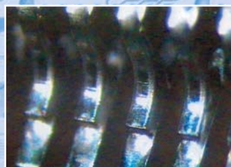
Технологические решения по переходу на бессвинцовые технологии