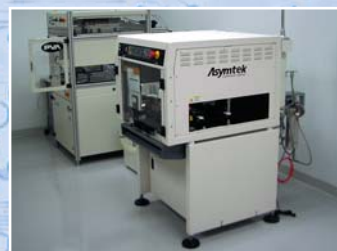
Соперник ли УР-23 современным влагозащитным материалам?