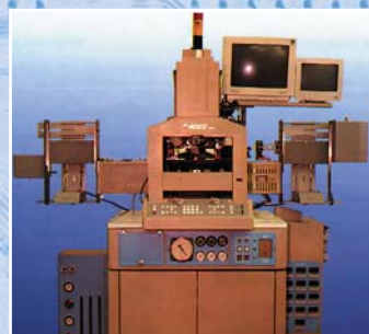
Автоматизированный монтаж кристаллов транзисторов вибрационной пайкой