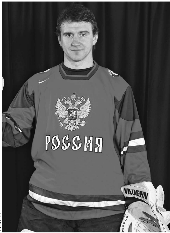
Болельщики привыкли видеть Евгения Набокова в маске — защитную амуницию он снимает редко

ОФИЦИАЛЬНЫЕ (ЦЕНТРАЛЬНЫЙ БАНК РФ) КУРСЫ ВАЛЮТ К РУБЛЮ НА 18 АВГУСТА