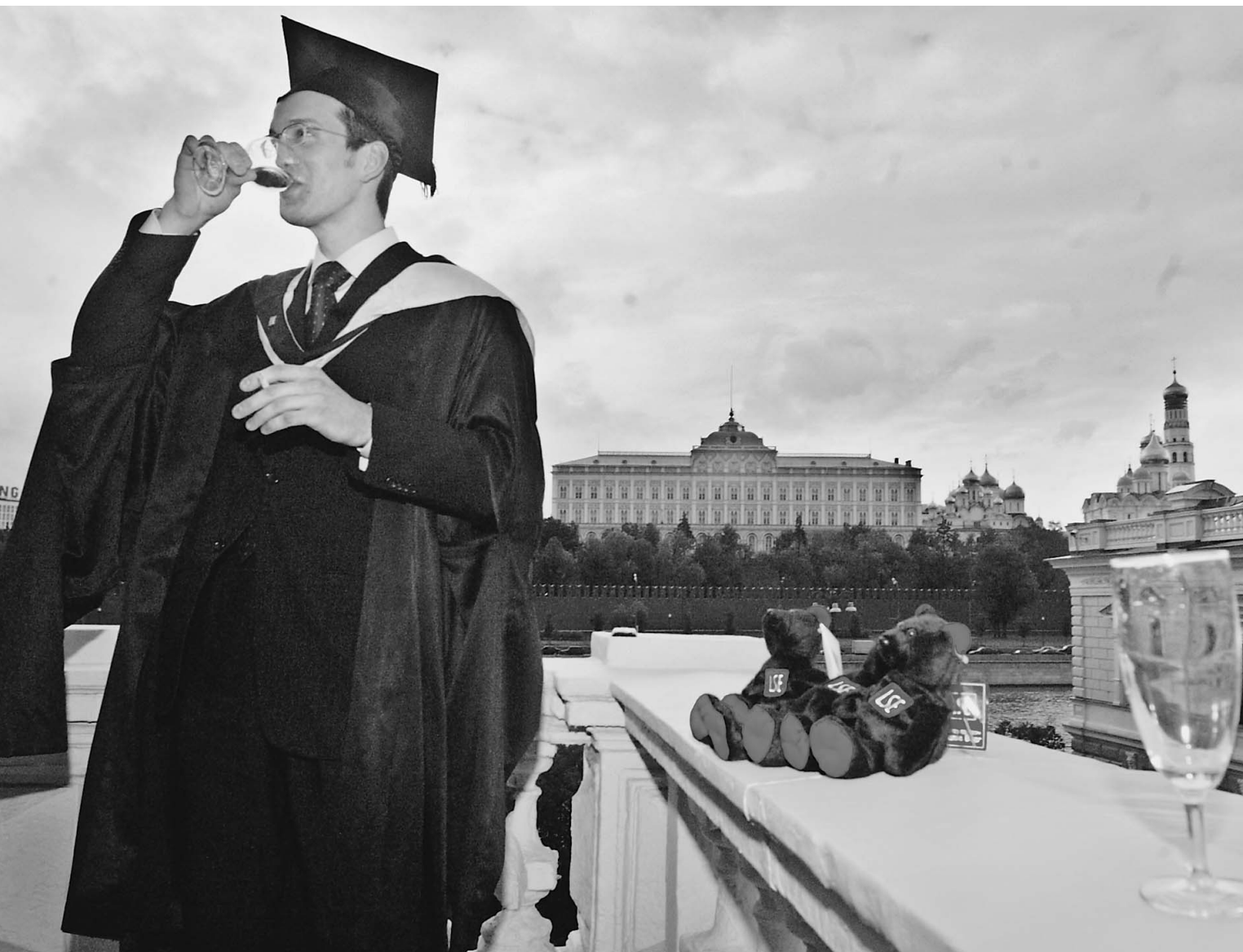
Потенциальные управленцы уверены: только госслужба даст им стабильный и высокий заработок

Российская молодежь сделала свой выбор: она пошла в чиновники