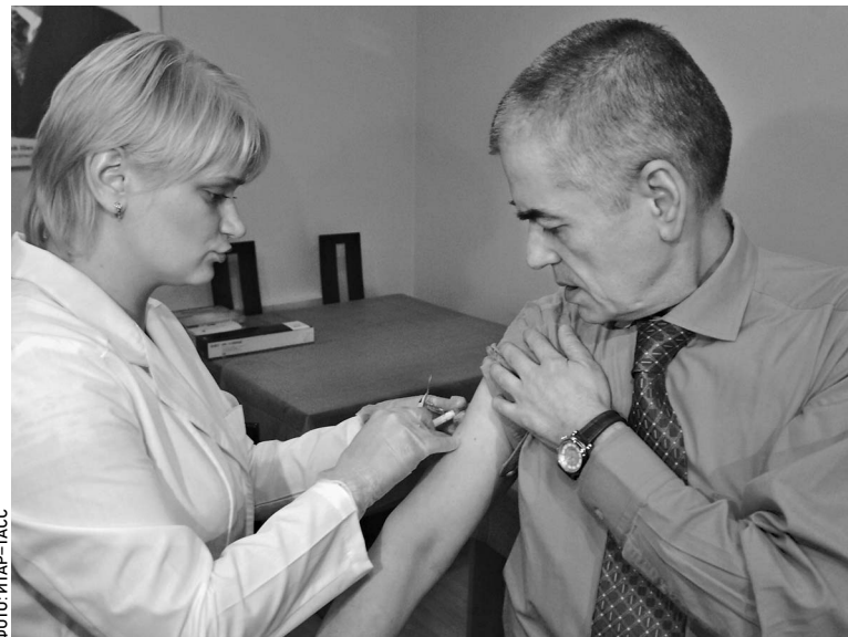
Даже высокопоставленные чиновники (на фото — главный санитарный врач Геннадий Онищенко) в случае болезни пойдут с бюллетенем не в бухгалтерию, а в фонд социального страхования

К реформе Фонд социального страхования приступает осторожно. В будущем году запускают пилотный проект в двух регионах (где — пока не говорят), к 2013 году по новым правилам заживет вся Россия. Правда, что же это за правила и как именно действовать человеку с больничным листом на руках — это