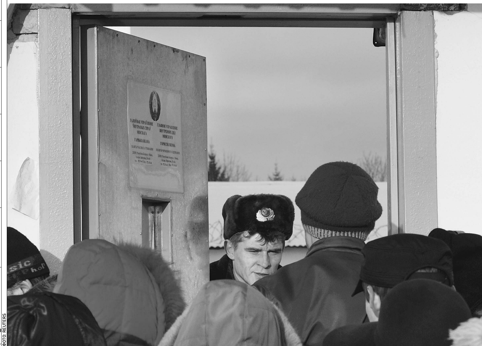
Родственникам арестованных еще долго придется носить передачи в тюрьму

В Белоруссии прошел судебный экспресс-процесс над участниками митинга