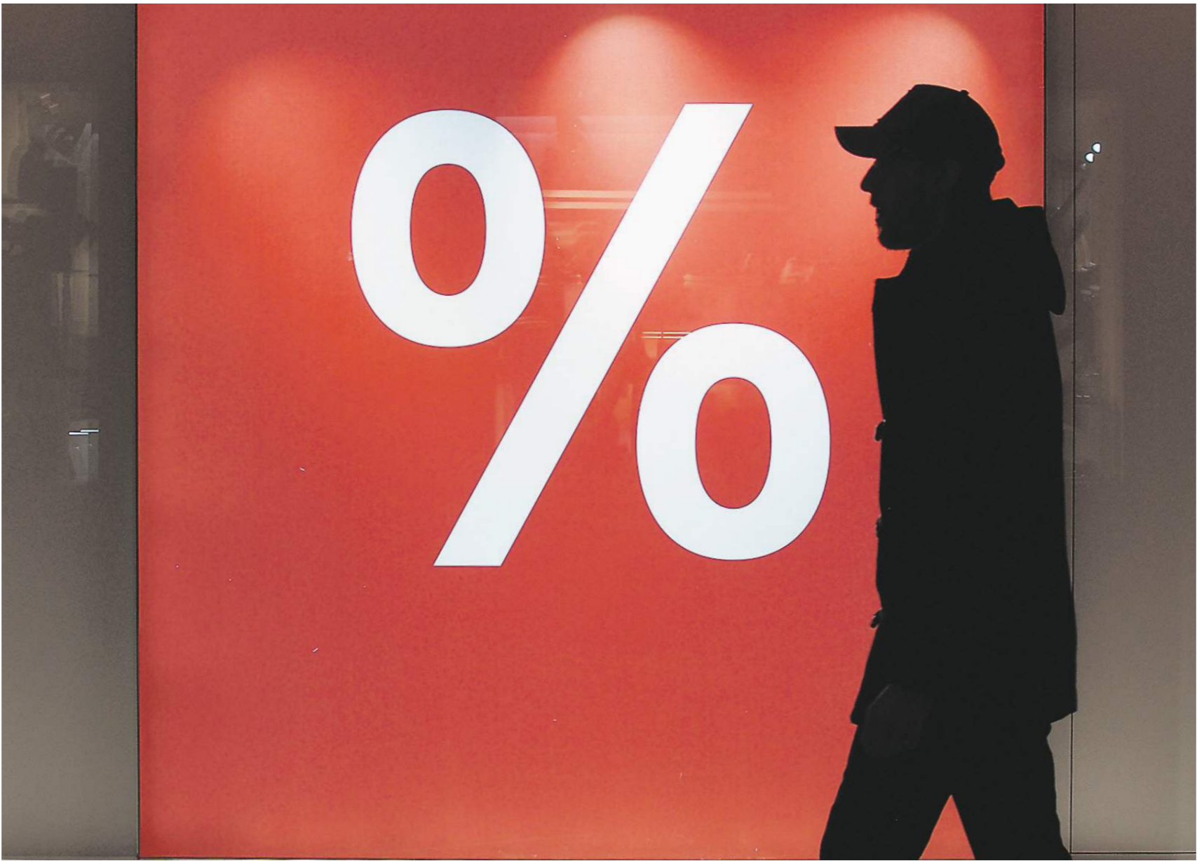
Marlon Tretmann / Depositphotos