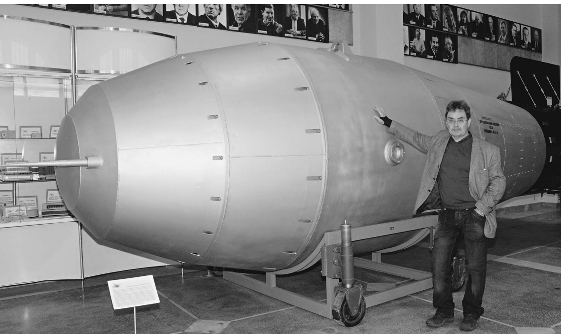
Корреспонденту «Известий» не удалось обнять самую большую в мире бомбу «Кузькину мать»

ОФИЦИАЛЬНЫЕ (ЦЕНТРАЛЬНЫЙ БАНК РФ) КУРСЫ ВАЛЮТ К РУБЛЮ НА 13 МАРТА