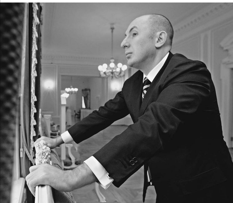
Владимир Кехман считает, что все музыкальные театры страны пора модернизировать