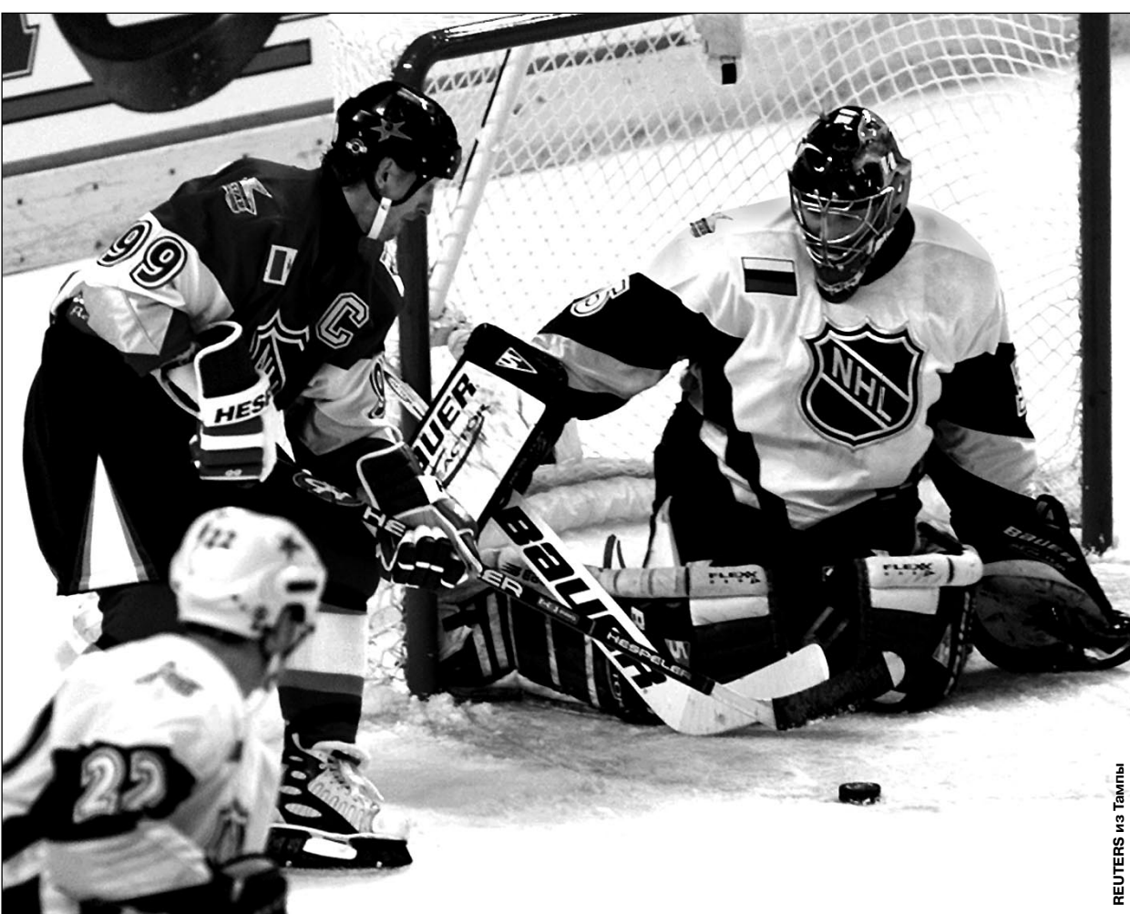
из Тампы

В оскресенье матчем сборных Северной Америки и Европы в Тампе завершился звездный уик-энд. Команда заокеанских хоккеистов взяла у представителей Старого Света реванш за поражение по итогам первого дня уик-энда, в ходе которого проводились 7 конкурсов. Как и в прошлом году, когда матч «Всех звезд» впервые проходил по формуле «Европа против Америки», сборная хозяев победила европейских — 8:6. Самым ценным хоккеистом встречи в третий раз в его легендарной карьере назван Уэйн Гретцки, который участвовал в своем 18-м «звездном» матче и которому сегодня исполняется 38 лет. В качестве приза Великий получил новейшую модель автомобиля Dodge Durango.