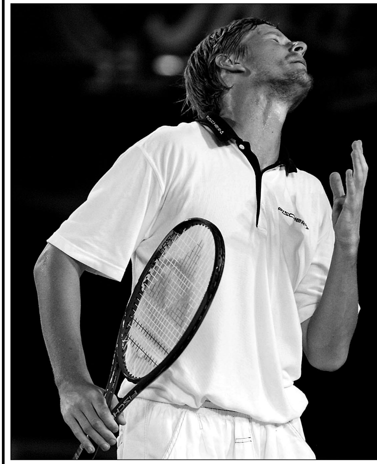
REUTERS из Мельбурна

Российянин Евгений Кафельников вышел вчера в четвертьфинал Открытого чемпионата Австралии. В последнем вечернем матче на Центральном корте «Мельбурн Парка» он за 3 часа 33 минуты обыграл 53-го ракетку мира румына Андрея Павела — 6:3, 7:6 (7:5), 6:7 (5:7), 3:6, 6:4. Следующим соперником Кафельникова будет 13-й номер рейтинга АТР американец Тодд Мартин.