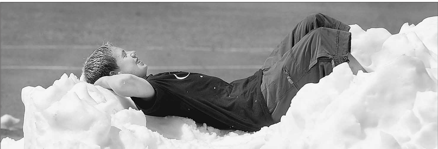
На вершине счастья

Еще год назад на нашем телевидении телевикторины было раздвинуто и обнесено. Бессмертные «Поле чудес». Необычайно интеллектуализированная «Своя игра», чисто русская забава «Что? Где? Когда?» и еще быстро завоевавшая популярность «Кто хочет стать миллионером», которая поначалу, будучи прописанной на канале НТВ, называлась «О, счастливицы!». Сегодня их пруд пруди. Тут и «Алчужность», и «Слабое звено», и «Обратный отсчет». Ну а кроме того, нигде не девшиса все те же «Поле чудес», «Своя игра». Отношение публики к этому разделу вещания, как к Клондайку. Ощущение, что там шальные деньги, там волею Его Величества Случая можно хорошо заработать. Ну не