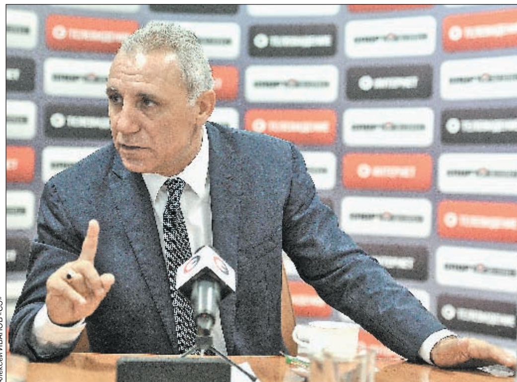
Вчера, Москва. Христо СТОИЧКОВ в редакции «СЭ».

Полностью интервью со Стоичковым - в одном из ближайших номеров «СЭ» и на сайте www.sport-express.ru