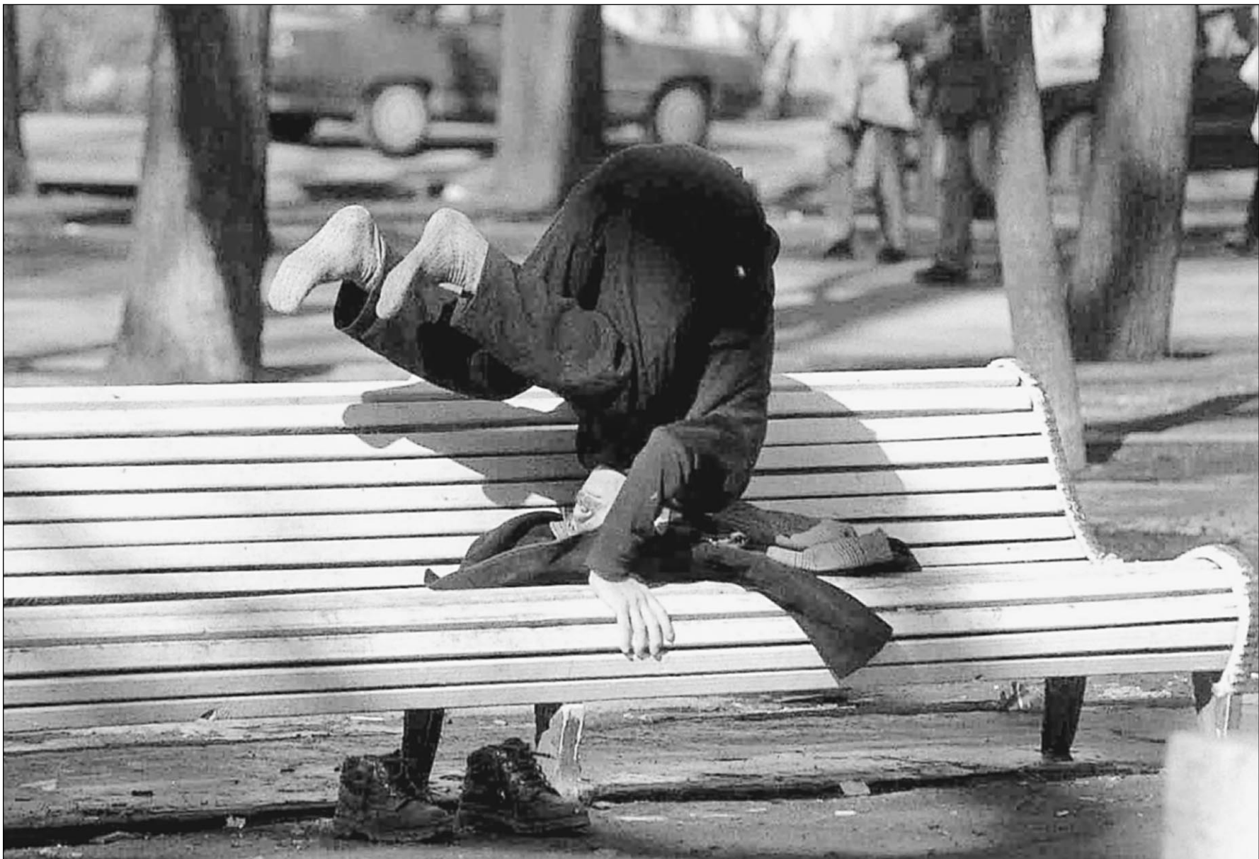
Посмотрим на мир иначе