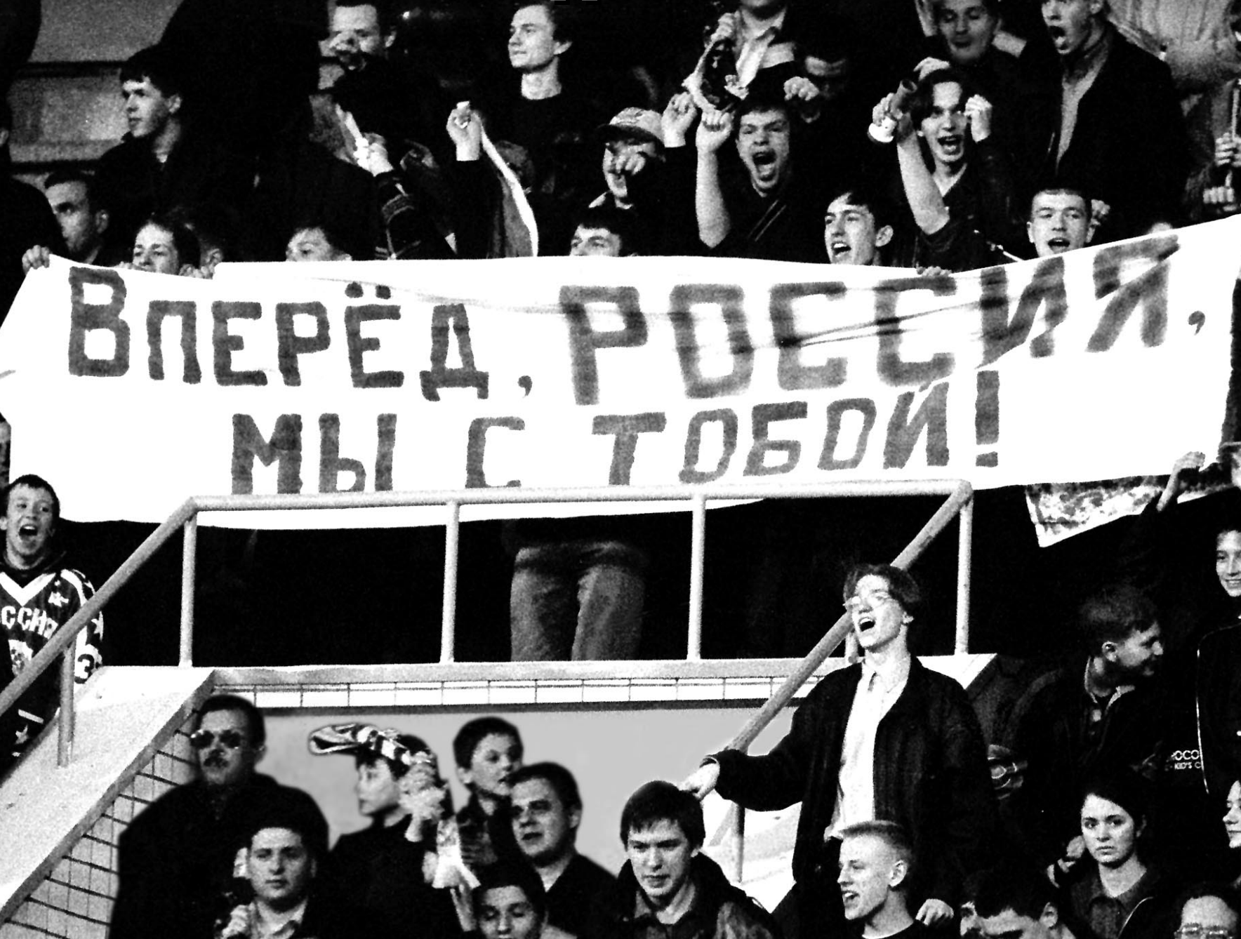
Вчера. Москва. Стадион «Локомотив». Россия - Андорра - 6:1. Поддержать нашу сборную пришли 15 тысяч болельщиков.

Турнир без явных фаворитов обещает стать самым интригующим в российской истории