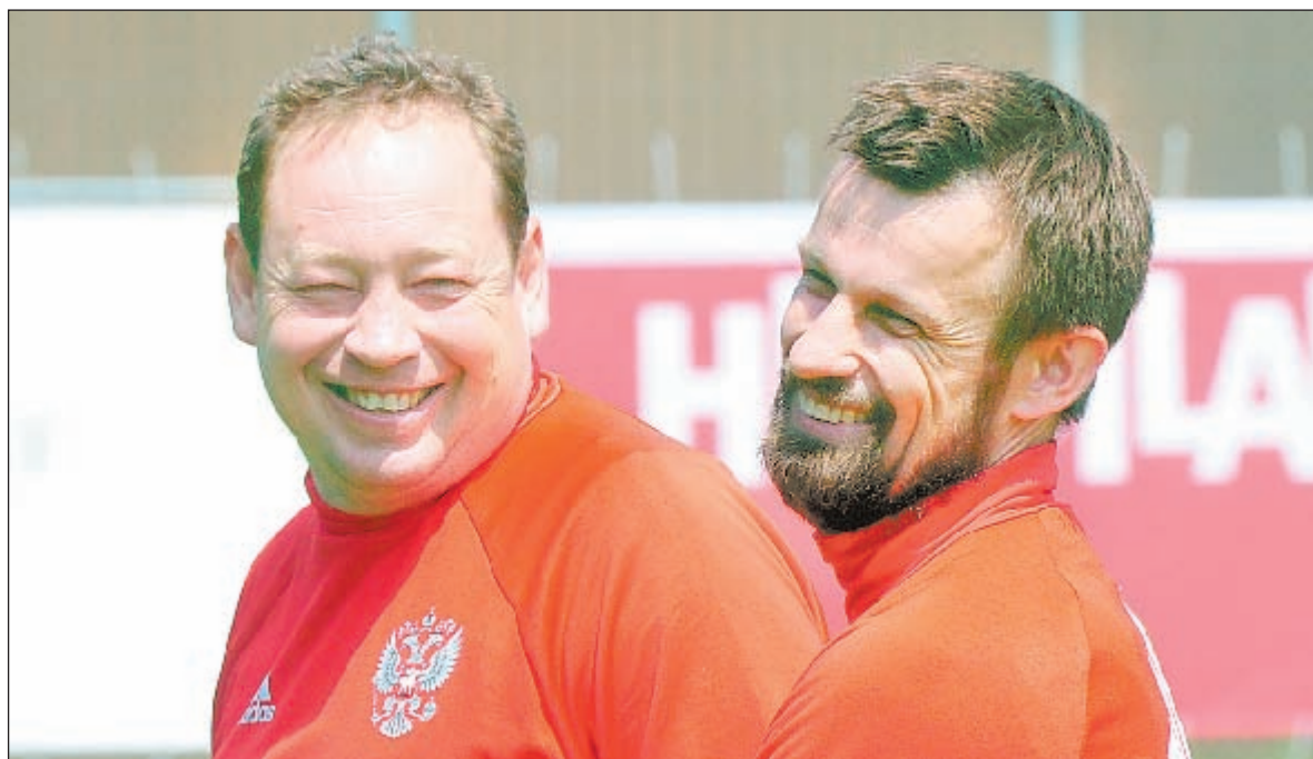
Май 2016 года. Бад Рагац. Леонид СЛУЦКИЙ (слева) и Сергей СЕМАК во время подготовки сборной России к Евро-2016.

Один из самых уважаемых людей в нашем футболе, экс-тренер «Зенита» и сборной России, в декабре прошлого года возглавив «Уфу», начал самостоятельную тренерскую карьеру. И сразу смог вывести команду в полуфинал Кубка России, а в чемпионате набрать 7 из 9 возможных очков. В откровенном интервью «СЭ» он поделился впечатлениями от работы в новом статусе, рассказал о помощи от Виллаш-Боаша и вспомнил, как трудился со Спаллетти и Капелло.