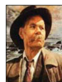
Алексей Максимович Горький

Заказать книги и журналы издательства и оформить подписку на издания можно на сайте