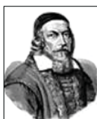
Ян Амос Каменский