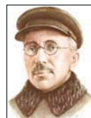
Антон Семёнович Макаренко