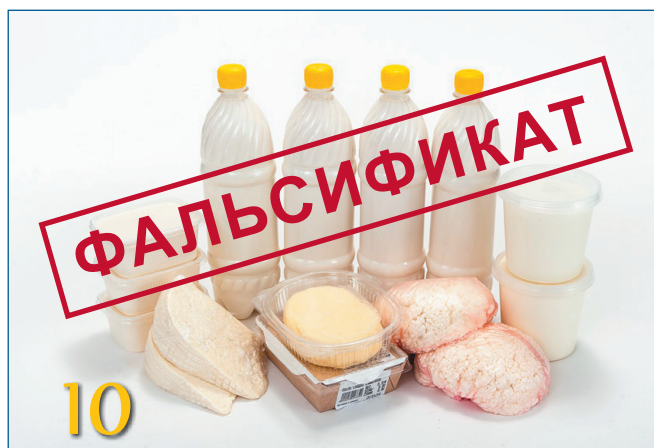
ПРОГРАММА ПО ЗАЩИТЕ ОТ ПИЩЕВОГО МОШЕННИЧЕСТВА (ФАЛЬСИФИКАЦИИ)