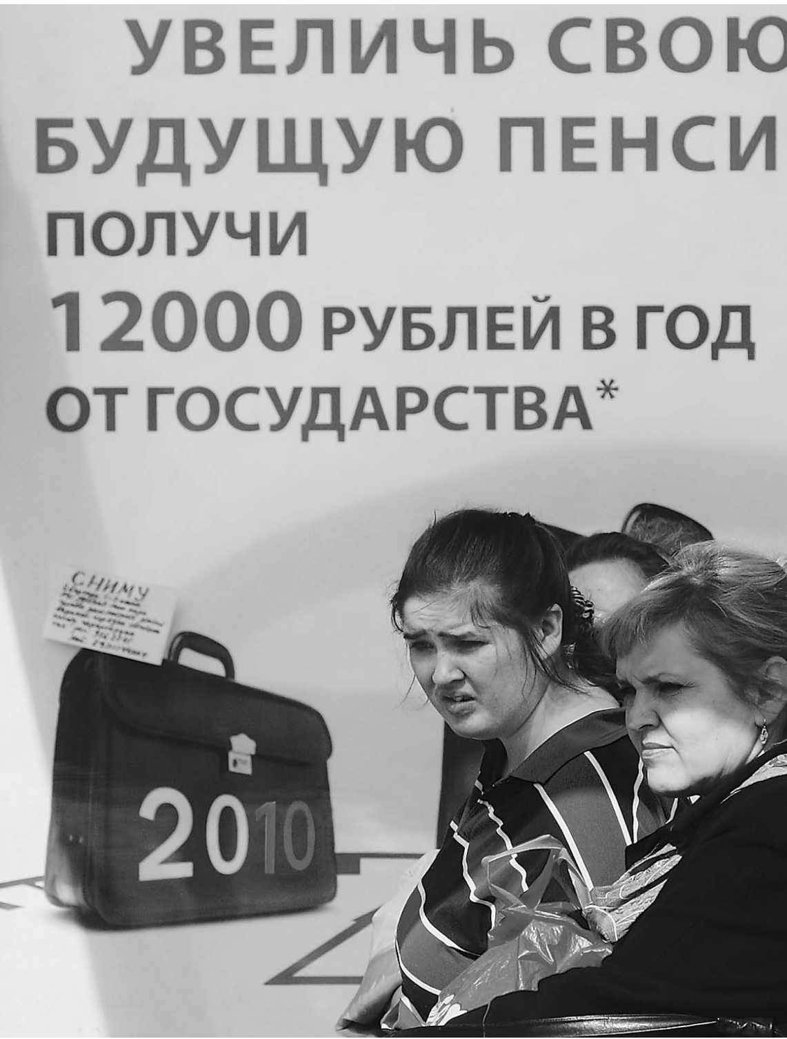
Государство готово помогать гражданам копить себе на пенсию