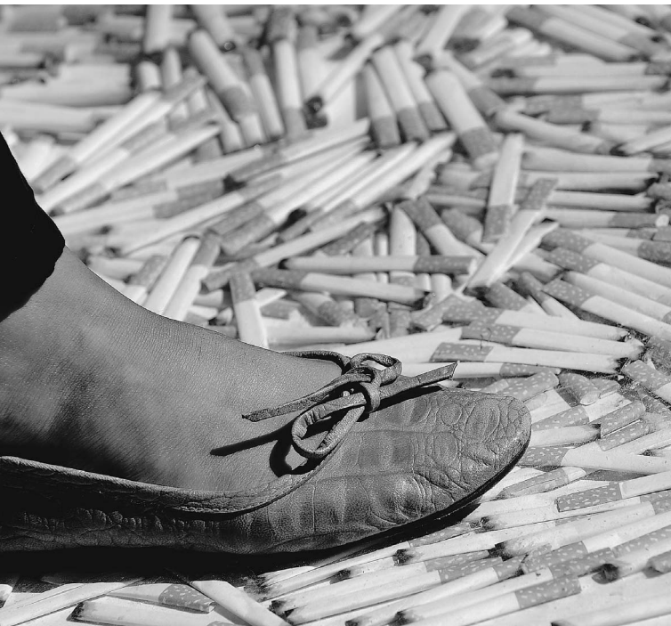
Главное — уберечь молодежь от пагубной привычки

Табачный рынок России сегодня на 95% принадлежит иностранцам. Они ищут любые пути для повышения своих доходов. И подчас подпись самого маленького чиновника помогает им решать очень большие проблемы.