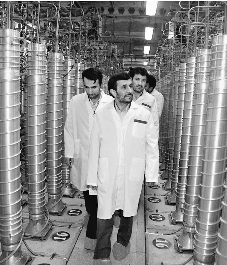
Президент Ирана Махмуд Ахмадинежад инспектирует завод по обогащению урана в Натанзе. Этот объект — одна из потенциальных мишеней израильтян и американцев