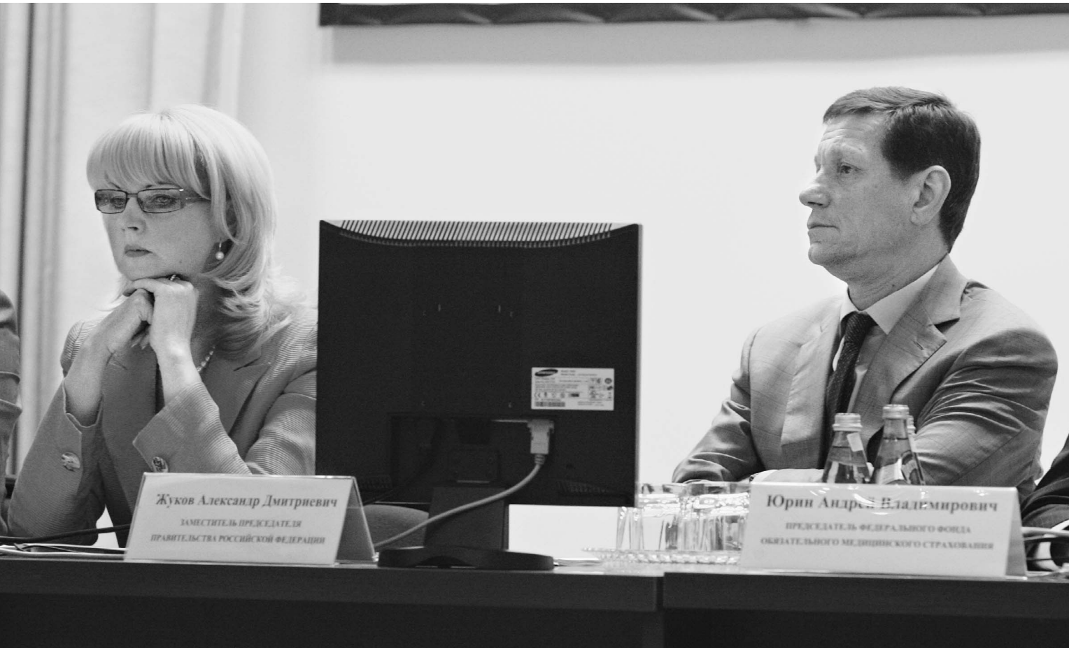
Министр Татьяна Голикова и вице-премьер Александр Жуков единодушно: задачи поставлены сложные, но решать их необходимо

Правительство потратит на здравоохранение 430 миллиардов рублей за два года