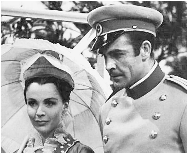
Клер Блум (Анна) и Шон Коннерри (Вронский) в фильме «Анна Каренина»