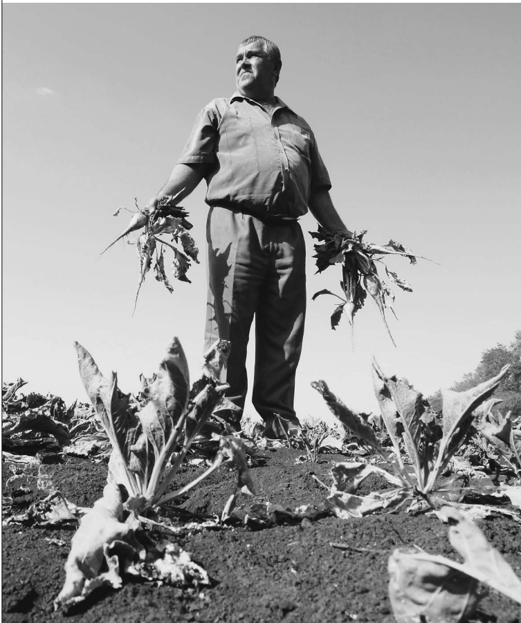
Вместо сочных корешков сахарной свеклы на многих полях остались зажаренные на солнце вершки