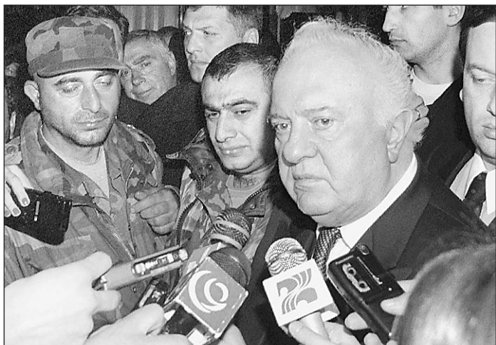
Эдуард Шеварднадзе сильно обиделся на российских политиков

— Всеобщая мобилизация в республике еще не объявлена, лишь частичный призыв резервистов. Возможно, вопрос всеобщей мобилизации будет поставлен в ближайшее время. Самолеты, которые бомбили абхазские селения, однозначно принадлежали ВВС Грузии. Мы уверены также, что официальные власти Грузии причастны к втор-