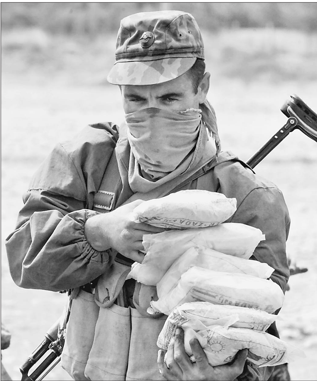
Пограничники Московского погранотряда задерживают только 20 процентов героина

Если талибы пойдут на Таджикистан, главным оружием наших пограничников будет героизм