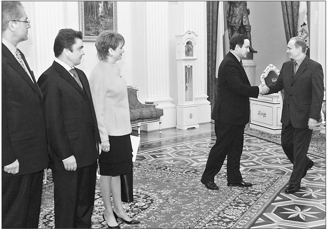
16 октября. Владимир Путин принимает представителей малого и среднего бизнеса