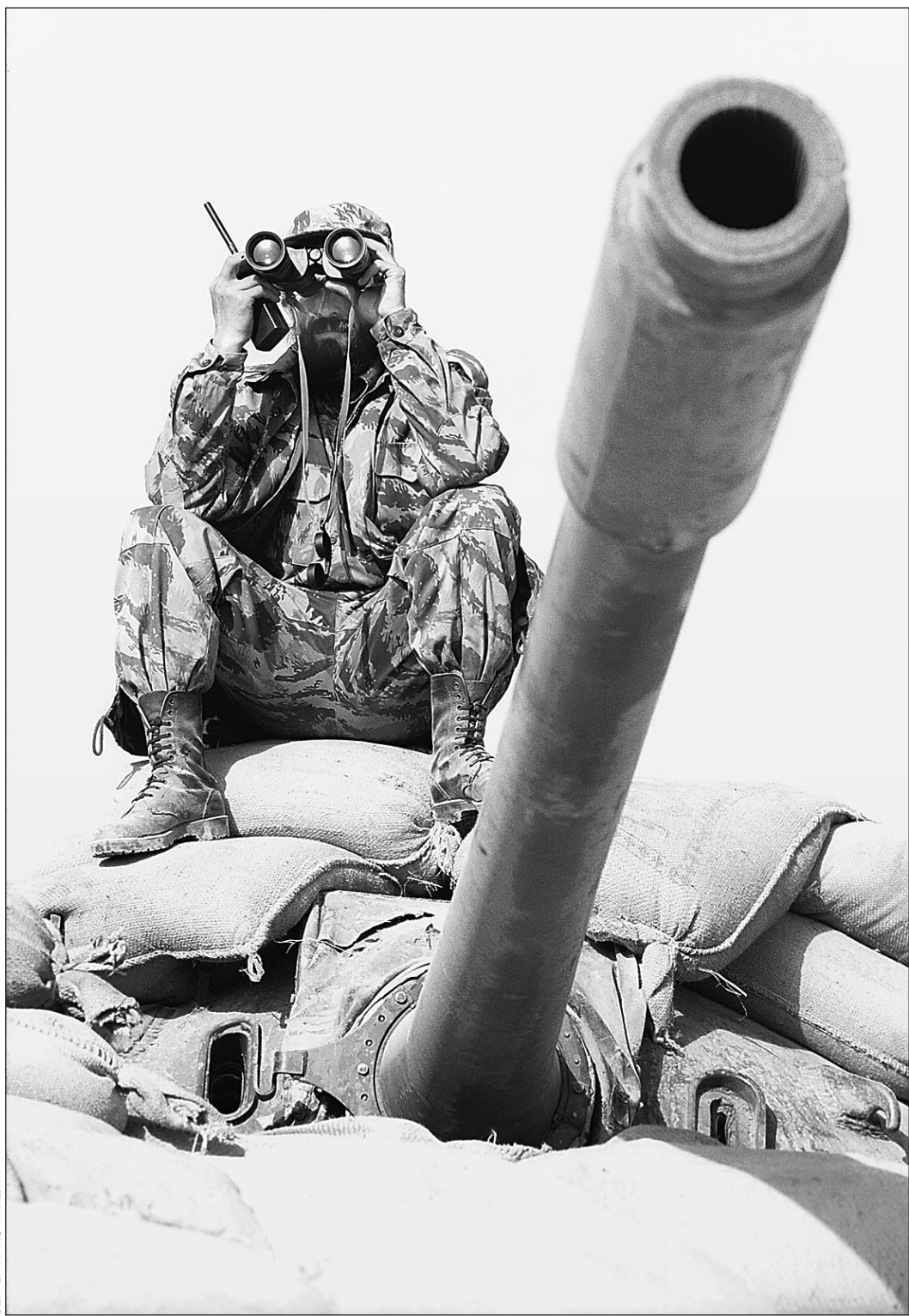
Бойцы Северного альянса уже видят Мазари-Шариф в бинокль