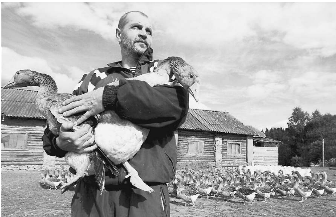
Пока одни о пространстве размышляют, другие его обустривают. Как могут