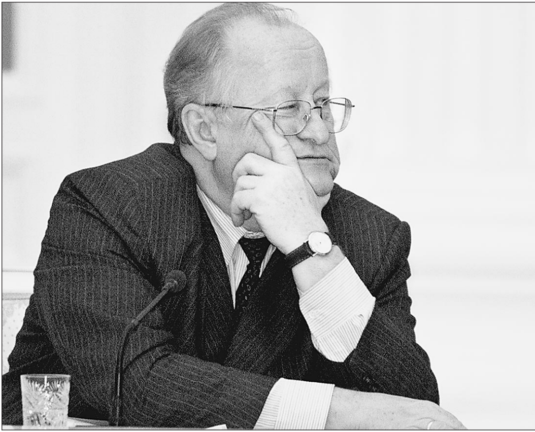
Гарант валютного курса

Почем он нынче? Подороже, чем неделю назад, и изрядно дороже, чем две недели назад. Вчера — 30,28 рубля за доллар. И это официальный курс рубля, который устанавливает Центробанк и который важен для проведения финансовых расчетов. На