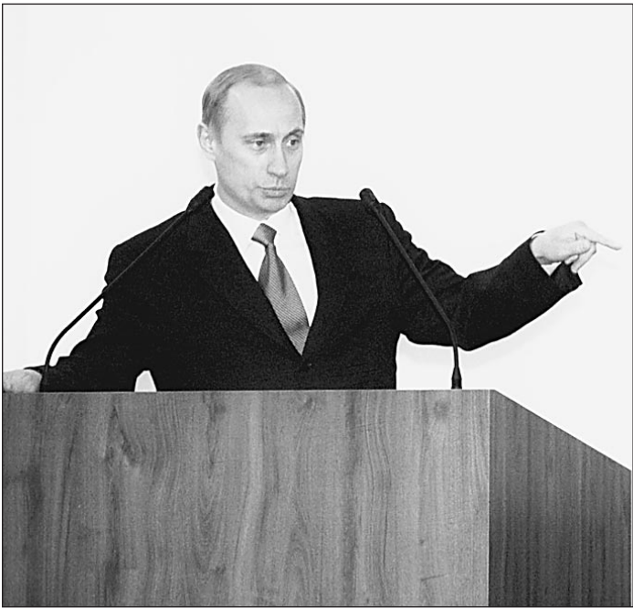
Гарант политического курса