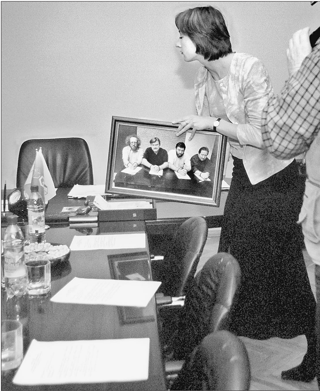
14 января. В этом кабинете должно было состояться собрание акционеров ТВ-6

Теперь почти не осталось шансов на то, чтобы сохранить ТВ-6 в нынешнем виде. В апреле пройдет конкурс, и реальных претендентов будет четыре. Это нынешняя команда канала во главе с Евгением Киселевым — если она примет предложение «ЛУКОЙЛа» и образует новую телекомпанию, без Березовского. Это владельцы телеканала «Московия», которые активно