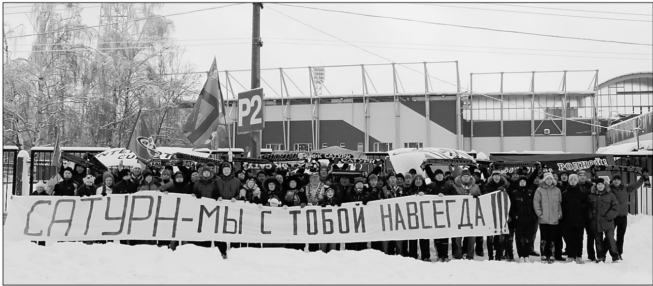
3 января. Раменское. Болельщики «Сатурна».

В канун Нового года стало известно о том, что в российской премьер-лиге больше не будет подмосковного «Сатурна». Мыслями и ощущениями по этому поводу с корреспондентом «СЭ» поделился один из самых опытных футболистов черно-синих.