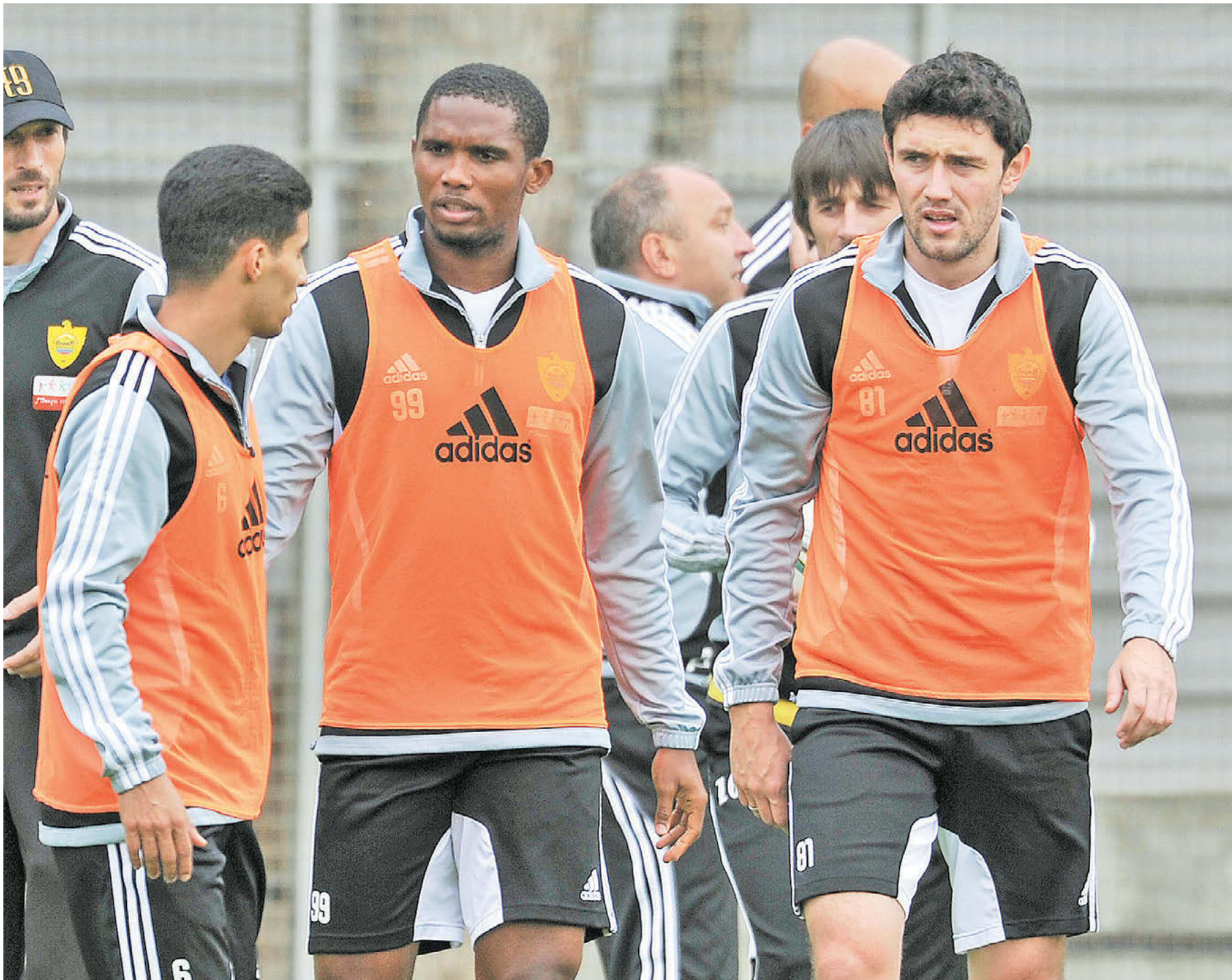
2011 год. Кратово. Звезды «Анжи» Юрий Жирков, Самюэль Это'О и Мубаран Буссуфа (справа налево)

Откровенный разговор с бывшим форвардом «Анжи»