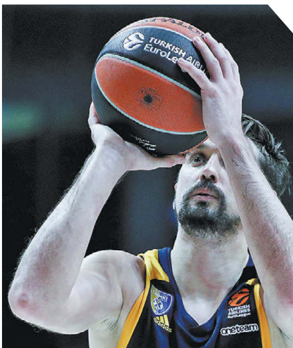
Дарья Исаева «СЭ» / Canon EOS-1D X Mark II