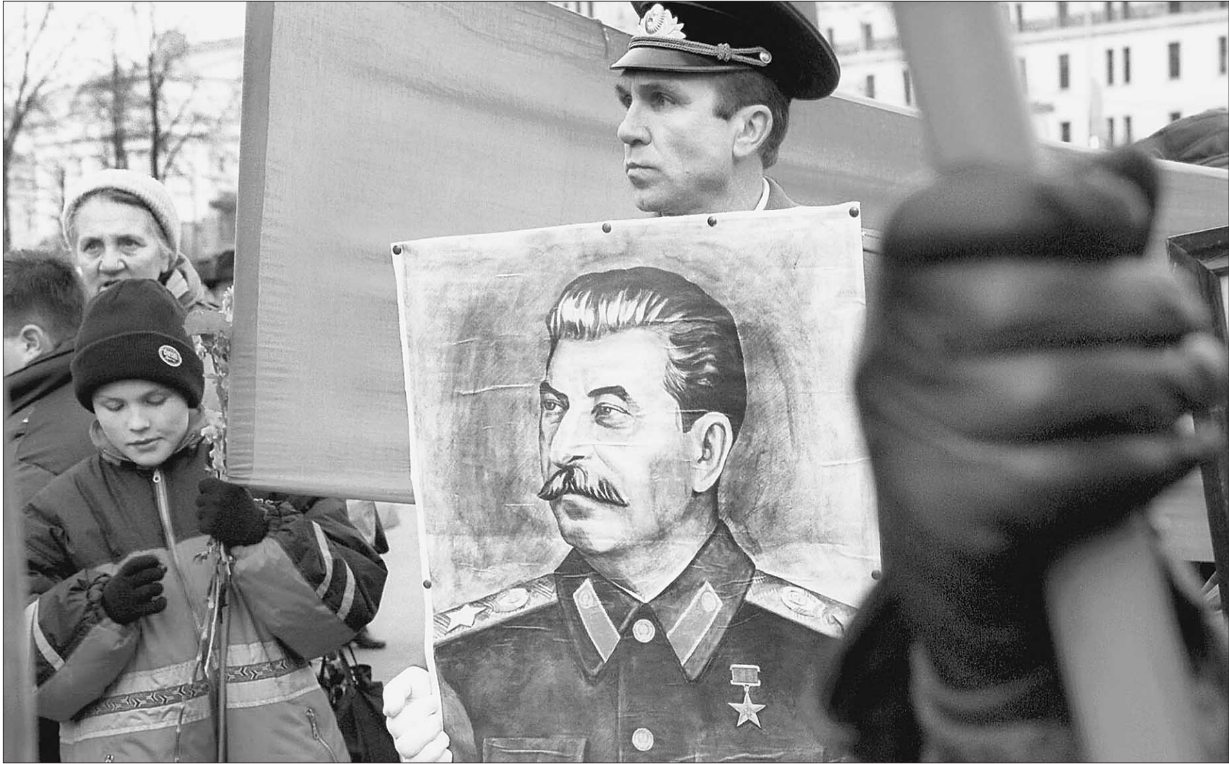
Наследники Сталина. Они по-прежнему рядом

На эти передачи и публикации можно было бы не обращать никакого внимания. Если бы не исторический контекст, внутри которого все мы живем и мыслим. Потому что фильмы и статьи о Сталине появились в таком труднообъяснимом количестве и еще более труднообъяснимом качестве только сейчас. А сначала был возвращен — пусть подновленный, пусть подчищенный — коммунистический гимн. Затем армии подарили красное революционное знамя, под которым она не только одержала победу в Великой Отечественной, но, между прочим, заливая русской кровью поля гражданской войны. Совсем недавно зашла речь о красной пятиугольной звезде, прилегающей