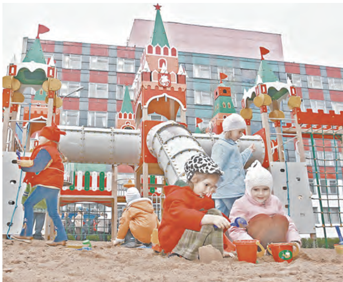
Эту детскую площадку москвичи возвели для маленьких жителей с улицы Ленинской в белорусском Могилеве.

АНОНС / Наш репортер в Минске записался на необычные курсы по распознаванию птичьих голосов Не свисти, дружок!