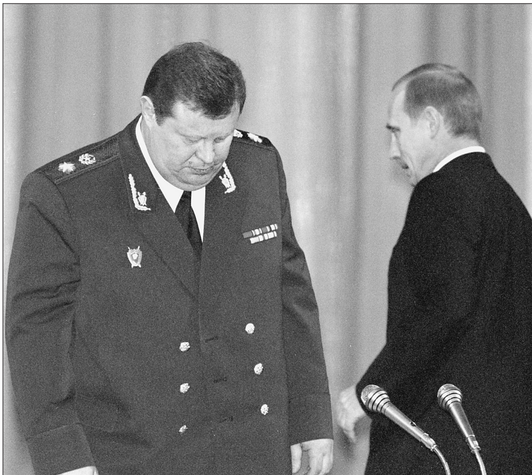
11 января. Созвоились, встретились. Президент беседует с генеральным прокурором

— Друзья! Надеюсь, вы еще не начали отмечать свой профессиональный праздник, и мы