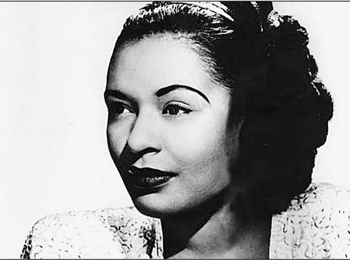
«Леди джаз» Билли Холидей