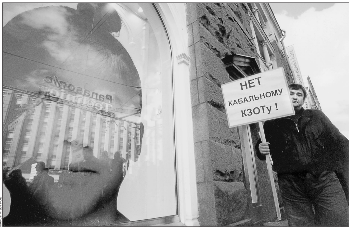
КЗоТу нет. И не будет