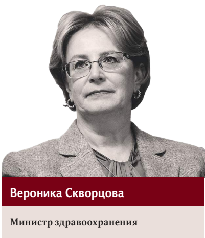
Вероника Скворцова Министр здравоохранения

За последние годы здоровье жителей Дальневосточного федерального округа серьезно изменилось к лучшему. Главными индикаторами реальных перемен в этом плане являются демографические показатели — продолжительность жизни и смертность. Благодаря предпринимаемым усилиям с 2012 года ожидаемая продолжительность жизни на Дальнем Востоке увеличилась более чем на два года, впервые в истории превысив 69 лет. Смертность, напротив, снизилась с 13,1 до 12,5 на 1 тысячу населения. Когда-то Константин Симонов сказал, что Дальний Восток — это